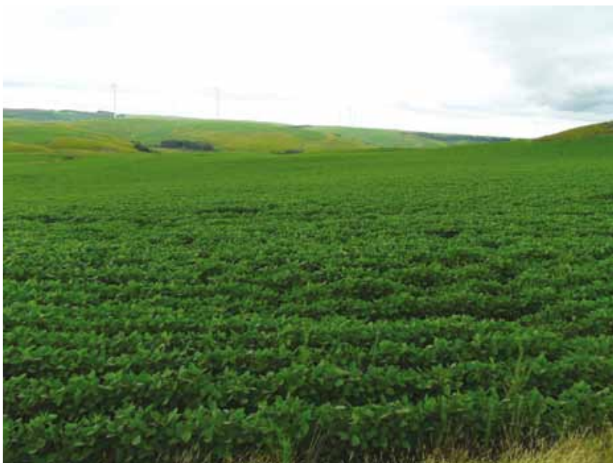
Figura 2. Área de campo nativo convertido em lavoura de soja na região dos Campos de Palmas

vicicultura estão perdendo seu potencial turístico e cultural. Além da paisagem ser um atrativo para o turismo, a sua manutenção é essencial para a identificação cultural das comunidades locais e seu bem-estar (BOLDRINI, 2006).