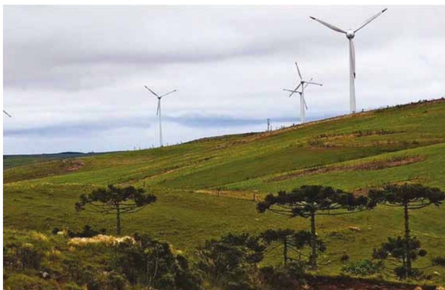
Figura 3. Turismo na região dos Campos de Palmas destacado pelas belezas naturais dos campos e pela presença de uma usina eólica.

A produção animal a pasto é uma das principais atividades econômicas nos campos do sul do Brasil. Segundo Nabinger et al. (2000), esse é considerado o principal fator mantenedor das propriedades ecológicas e das características fisionômicas dos campos. Na região dos Campos de Palmas, a partir de 1840, surgiram as primeiras famílias se dedicando à criação e invernagem de gado, atividade que até os dias de hoje é responsável por boa parte da econo-