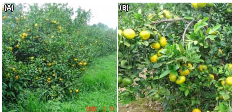
Figura 1. Plantas de 'SCS458 Osvino' nos municípios de Cocal do Sul (A) e Biguaçu (B), Santa Catarina, com boa carga de frutos e evidenciando a característica do cultivar de apresentar copa aberta e ramos pendentes devido ao peso da alta produção.

As plantas apresentam porte que varia de médio a grande, crescimento lento, com ramos abertos, pendentes, sem ramificações laterais e boa produtividade. Além disso, praticamente não apresentam espinhos, salvo em ramos mais vigorosos. A característica da copa aberta e dos ramos pendentes reforça a importância do raleio, não apenas para a obtenção de frutos de bom calibre, mas também para evitar o peso excessivo dos frutos em anos de boa carga e, conseqüentemente, quebra de ramos (Figura 1). Também é importante rea-