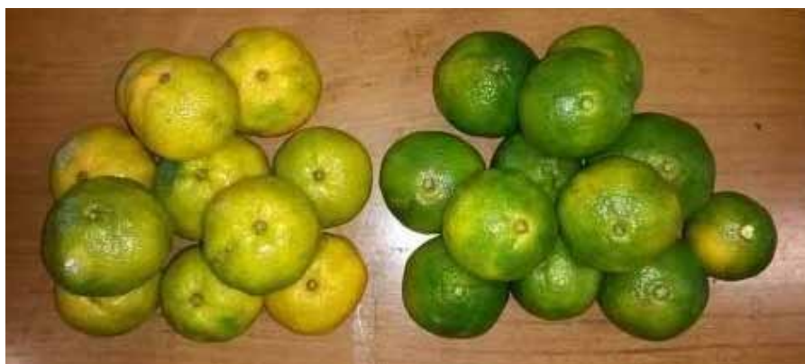
Figura 3. Frutos de ‘SCS458 Osvino’ (aptos para colheita) e ‘Okitsu’, em Águas Frias, SC

precocidade, outro diferencial do cultivar é a ausência de sementes, mesmo em plantios mistos com outras variedades (Figura 2D). Segundo Frost & Soost (1968), as Satsumas normalmente não formam pólen viável e, em muitos casos, também apresentam defeito no desenvolvimento dos óvulos, não produzindo sementes.