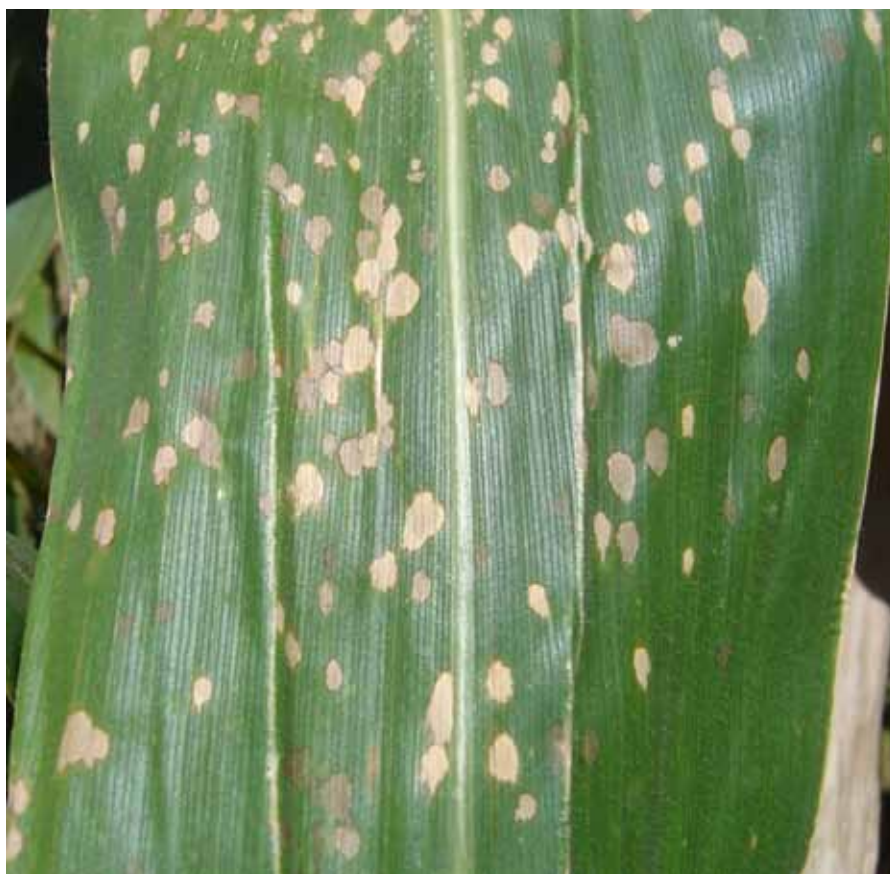
Figura 2. Sintoma de mancha branca em folha de milho.

As perdas causadas por essa doença são dependentes da suscetibilidade do hospedeiro, do estádio de desenvolvi-