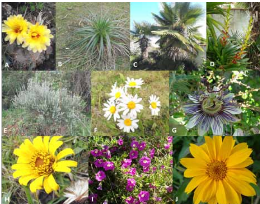
Figura 1. Imagens das espécies estudadas: (A) Parodia ottonis , (B) Eryngium horridum , (C) Trithrinax acanthocoma , (D) Vriesea reitzii , (E) Baccharis uncinella , (F) Senecio bonariensis , (G) Passiflora caerulea , (H) Trichocline catharinensis , (I) Calibrachoa sellowiana , (J) Aspilia montevidensis