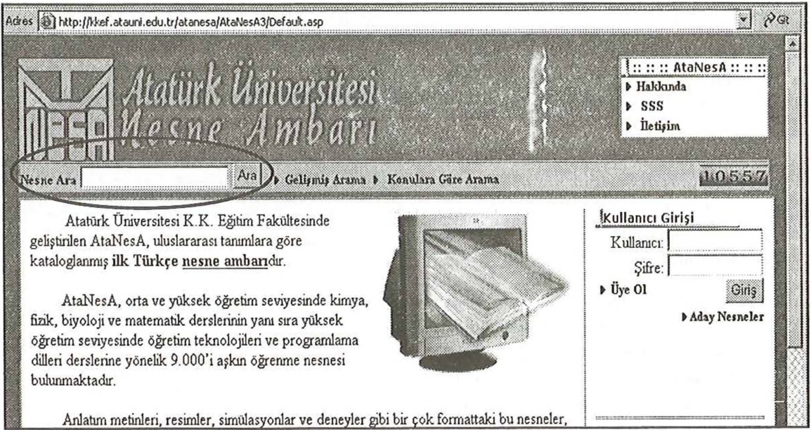
Şekil 3. AtaNesA Anasayfası

Basit arama: Girilen ifadenin nesneye ait başlık, açıklama ve anahtar kelime bilgileri içinde sorgulandığı bir arama türüdür.