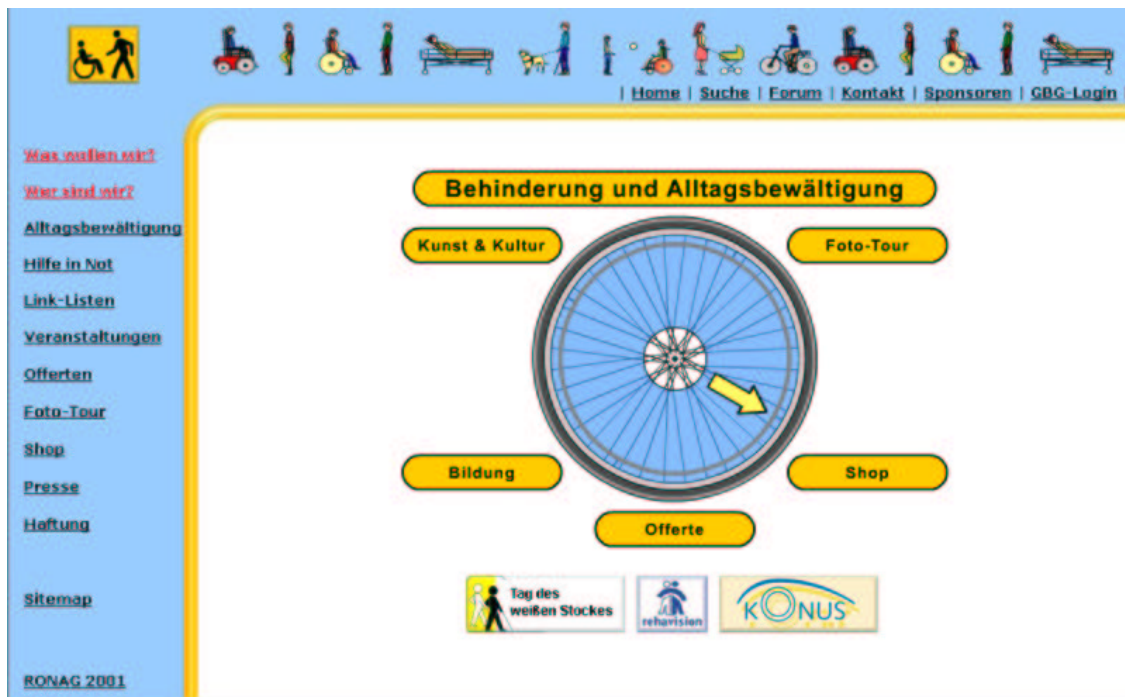
Abbildung 3: Homepage Behinderung und Alltag

An Menschen mit Behinderung denken, einander verstehen und miteinander leben - nehmen Sie sich gemeinsam mit uns dieser Thematik an.