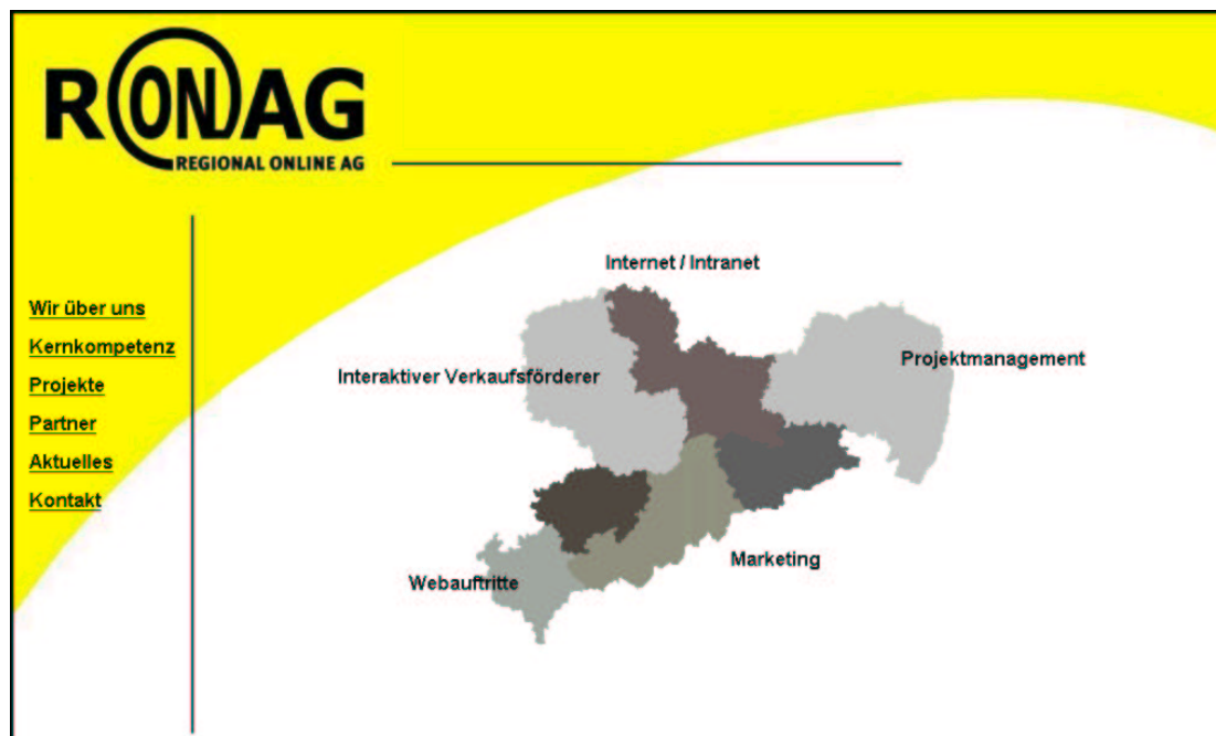
Abbildung 1: Homepage der RONAG

„...für Optimisten ist das Leben kein Problem, sondern bereits die Lösung.“