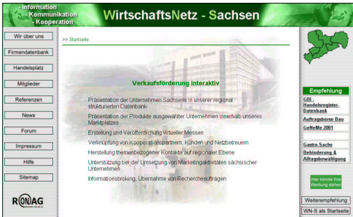
Abbildung 2: Homepage WN-S