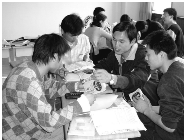
Abbildung 1: Deutschunterricht in Kleingruppen an der CDTF

Wissensstrukturierung und die hierzu notwendigen Werkzeuge sind vielfältig übertragbar und hängen in hohem Maße von dem Grad ab, in dem es gelingt Kooperations-, Koordinations- und Kommunikationsfunktionen in die kooperative Dokumentenverwaltung und -strukturierung zu integrieren.