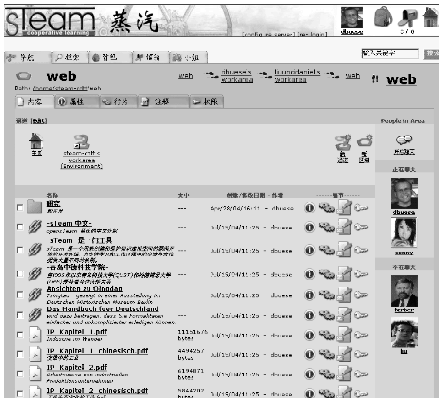
Abbildung 2: Deutsch- und chinesischsprachige Dokumente nebeneinander in einer Umgebung zur kooperativen Wissensstrukturierung

Die Nutzung kooperationsunterstützender Werkzeuge im chinesischen Sprachraum beginnt mit der Notwendigkeit einer UTF-8-Unterstützung. 14 Hierbei ist neben einer Verfügbarkeit der Benutzungsschnittstellen in chinesischer Sprache insbesondere eine Form der Multilingualität auf der Inhaltsebene zu entwickeln, die es erlaubt, chinesisch-, deutsch- und englischsprachige Dokumente gleichermaßen in einer Umgebung ablegen und in die kooperative Wissensstrukturierung einbeziehen zu können.