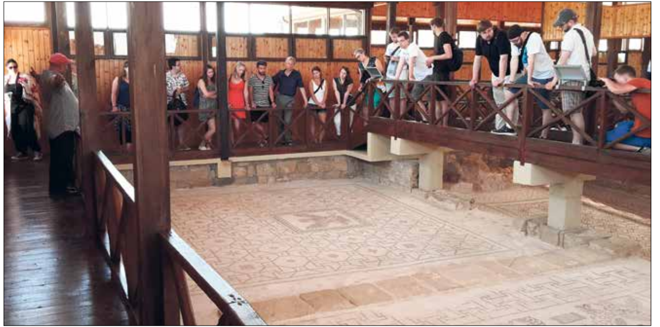
Die Studenten untersuchen die wunderbar erhaltenen Mosaiken von Pafos.

Obwohl Frauen und Männer unseres Fachs sich an diesen staubigen Realien natürlich nie sattsehen können, ist damit nur ein Schwerpunkt unserer Exkursion umrissen: Trotz der Auslebung unserer Antiquophilie waren wir doch nicht blind für all die jüngeren Entwicklungen des Landes. Besonders die politische Teilung Zyperns war ein Thema, welches an