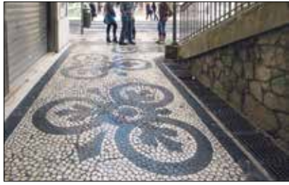
Dieses Motiv aus der Exposition wurde in Lissabon aufgenommen.