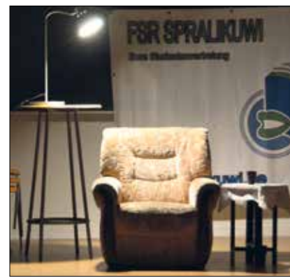
Ein Buch, ein Sessel, ein Vorleser – so wird es am 1. Juli mehrfach zu erleben sein.

nen Genres, Epochen und von unterschiedlichen Literaten vorgestellt zu bekommen, von zeitlosen Klassikern wie Kafka zu modernen Autoren wie Haruki Murakami, von »Die Pest« bis »Der Krapfen auf dem Sims«, von Fantasy bis Satire wird bei »Lies vor!« alles vorkommen. Dabei stolpert die eine oder der andere sicher über ein Buch, das man im Buchladen niemals auch nur in die Hand genommen hätte! Es werden während der Veranstaltung alle Bücher möglichst im vorgelesenen Original zur Verfügung stehen, um den Einband zu bestaunen oder den Klappentext oder die vorgestellte Stelle nachzulesen. Zwischen dem vielen