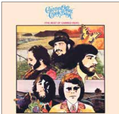
Canned Heat: »Cook Book – The best of Canned Heat« (Capitol, 1969).

»Cook Book – The best of Canned Heat« erschien bereits im Jahr 1969. Das ist insofern bemerkenswert, weil die US-amerikanische Band erst 1965 gegründet wurde. Die Mannen um den schwergewichtigen, vollbärtigen Sänger Bob »The Bear« Hite und den Gitarristen/Mundi-Spieler Alan »Blind Owl« Wilson hatten jedoch jene vier Jahre später schon beachtliche Blues- und Boogie-Erfolge vorzuweisen. Sie waren bereits eine der besten Bluesrockbands jener bunten Blumenkinderzeit.