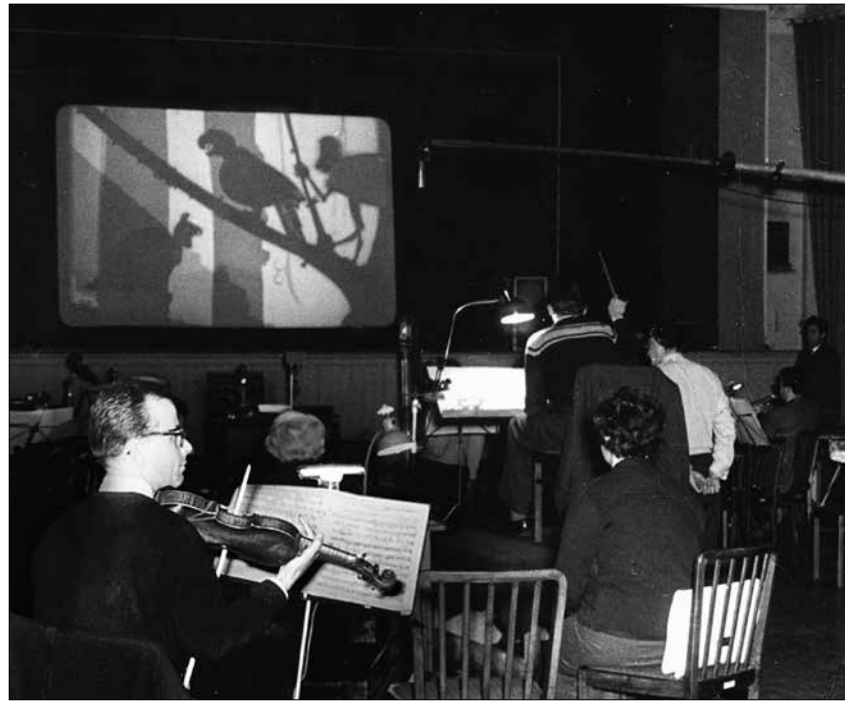
Tonaufnahmen zu »Warum jeder ein Körnchen Weisheit besitzt« (Bruno J. Böttge, 1959) im DEFA-Tonstudio in Gittersee.

Rätz, 1981) angewählt werden. Durch eigene Gestaltung des Tons ist zu erfahren, wie stark der Klang die Filmbilder beeinflusst. Nadja Rademacher/UJ