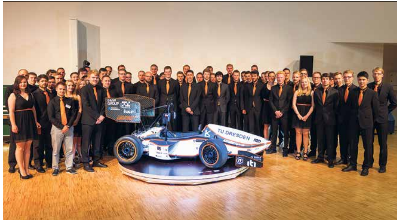
Der große Moment für das gesamte »Elbflorace«-Team: Sie präsentieren ihren neuen Flitzer »LucE« per »Roll Out«.

Die von der Commerzbank AG gestifteten Preise wurden zum 19. Mal vergeben. Seit 18 Jahren wird der Dr.-Walter-Seipp-Preis aus dem gleichnamigen Fonds der Commerzbank-Stiftung an besonders herausragende Dissertationen von jungen Nachwuchswissenschaftlern der TU Dresden verliehen. ckm