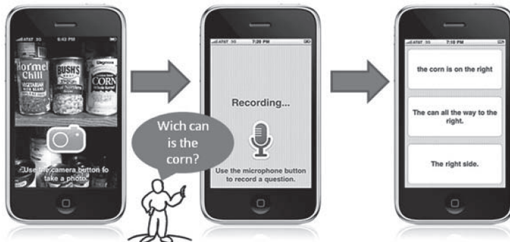
Abbildung 2: die VizWiz Smartphone App arbeitet in drei Schritten: ein sehbehinderter Nutzer macht ein Foto und nimmt eine Frage auf; beides wird an die Crowd gesandt, die die Antwort direkt zurück auf das Smartphone sendet; Quelle: [1]

In Zukunft ist darüber zu erwarten, dass das Crowdsourcing mehr und mehr ganze Geschäftsmodelle begründet. Amazon's Mechanical Turk aber auch der Internetanbieter iStockphoto, einer Börse auf der Fotografien von Crowdsources bereitgestellt werden und dann zur Veräußerung mittels Lizenzmodellen angeboten werden, stellen erste Beispiele hierfür dar. Das Prinzip ist dabei immer das Gleiche: Intermediäre nutzen die Schaffenskraft der Crowd, um die Ergebnisse dieser Schaffenskraft weiter zu veräußern.