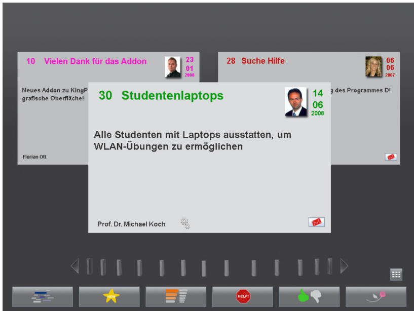
Abbildung 1: Standard-Darstellung von Elementen im Idea Mirror

Neben einer laufenden Nummer, die als einfaches Identifikationsmerkmal für die Ansicht/Bearbeitung in Desktop/Web-Systemen fungiert, besitzt jede Karte einen Status, der unten in der Mitte symbolisch angedeutet wird und die Ausprägungen „in Bearbeitung“, „angenommen“ und „abgelehnt“ haben kann. Weiterhin verfügen alle Karten im oberen rechten Bereich über ein Foto des Ideengebers und das Datum der Einstellung, damit ein ausreichender Bezug zur Aktualität der dargestellten Thematik und dem potenziellen Ansprechpartner gewährleistet ist. Zusätzlich kann eine Karte bei Bedarf durch den Button in der rechten unteren Ecke per E-Mail verschickt werden, um am Desktop ausführlichere Informationen des zugrundeliegenden Ideenmanagementsystems einsehen zu können.