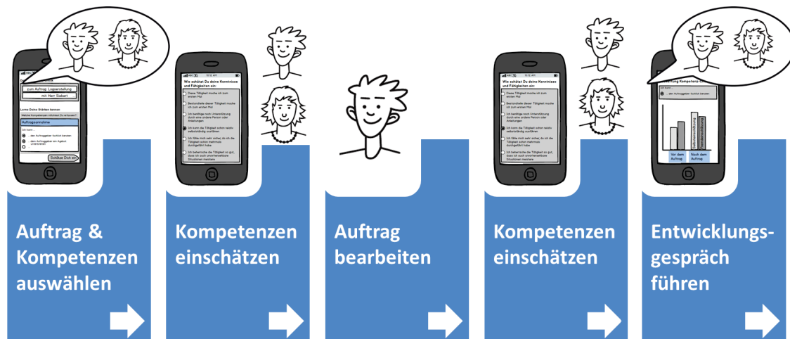
Abbildung 1: Phasen des Kompetenzchecks

Dabei treten Auszubildender und Ausbilder aus dem betrieblichen Geschehen heraus und reflektieren, angeleitet durch Fragen den durchlaufenen Arbeitsprozess sowie den Kompetenzerwerb und das visualisierte Kompetenzniveau. Auf Basis der Auswertung soll zukünftig festgelegt werden, wie die berufliche Entwicklung des Auszubildenden geeignet gefördert werden kann.