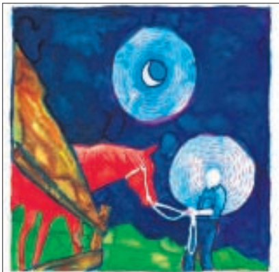
Iron & Wine und Calexico: »In the reins« (Touchandgo/Soulfood Music, 2005).

Wie dahinschwebende Federn, getrieben von einer leichten Sommerbrise, verbreiten sich diese wunderbaren Lieder. Denn eine einzigartige Ästhetik umgibt die Platte »In the reins«, die beim Cover beginnt und nicht eher verfliegt, bis der letzte Ton des letzten Songs verstummt ist. Zusammen mit den ebenso wunderbaren Calexico hat der Iron & Wine Sänger Sam Beam sieben Stücke hervorgezaubert, die die Gedanken abschweifen lassen und zu denen es sich herrlich tagträumen lässt.