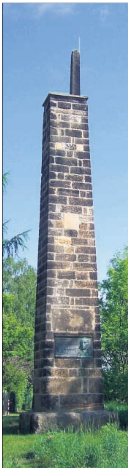
Die Rähnitzer Meridiansäule.