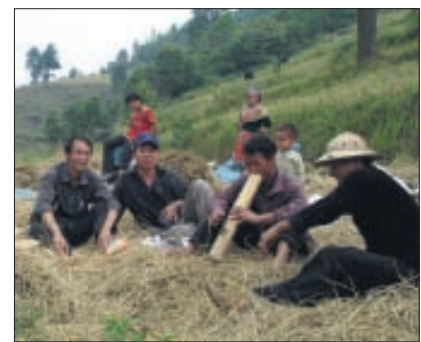
Gruppeninterview mit Landwirten auf dem Feld im Dorf Lung San.