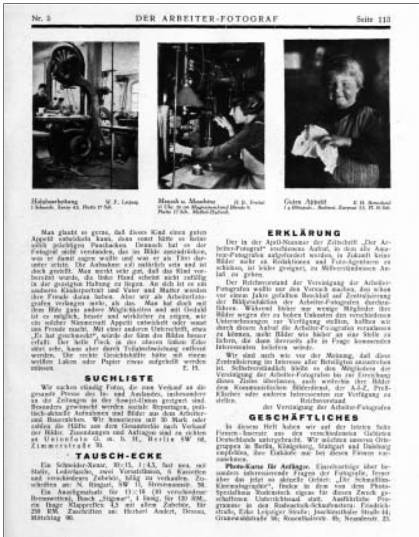
Im »Arbeiter-Fotografen« kann man die Vielfalt der Aktivitäten proletarischer Amateurfotografie nachvollziehen.

Das Forschungsprojekt will exemplarisch die insgesamt etwa 20 sächsischen Ortsgruppen der 1926 gegründeten »Vereinigung der Arbeiter-Fotografen Deutschlands« (VdAFD), von denen einige zu den aktivsten des Reichs gehörten, nach ihren Bildbeständen und Archivalien sowie in Hinblick auf ihre Publikationen in der Presse erschließen. Dabei sollen die lebensweltlichen Milieus der Akteure rekonstruiert, die Praxis der Herstellung und Distribution der Aufnahmen sowie in ikonografischer und stillhistorischer Perspektive der Realitätsbezug, die Traditionslinien und das utopische Potential der Bilder herausgearbeitet werden. Ziel ist es, individuelle und gesellschaftliche Symbolbildung im Kontext der Industrialisierung von Bildproduktion und -rezeption als Elemente von Volkskultur im frühen 20. Jahrhundert möglichst detailliert zu rekonstruieren.