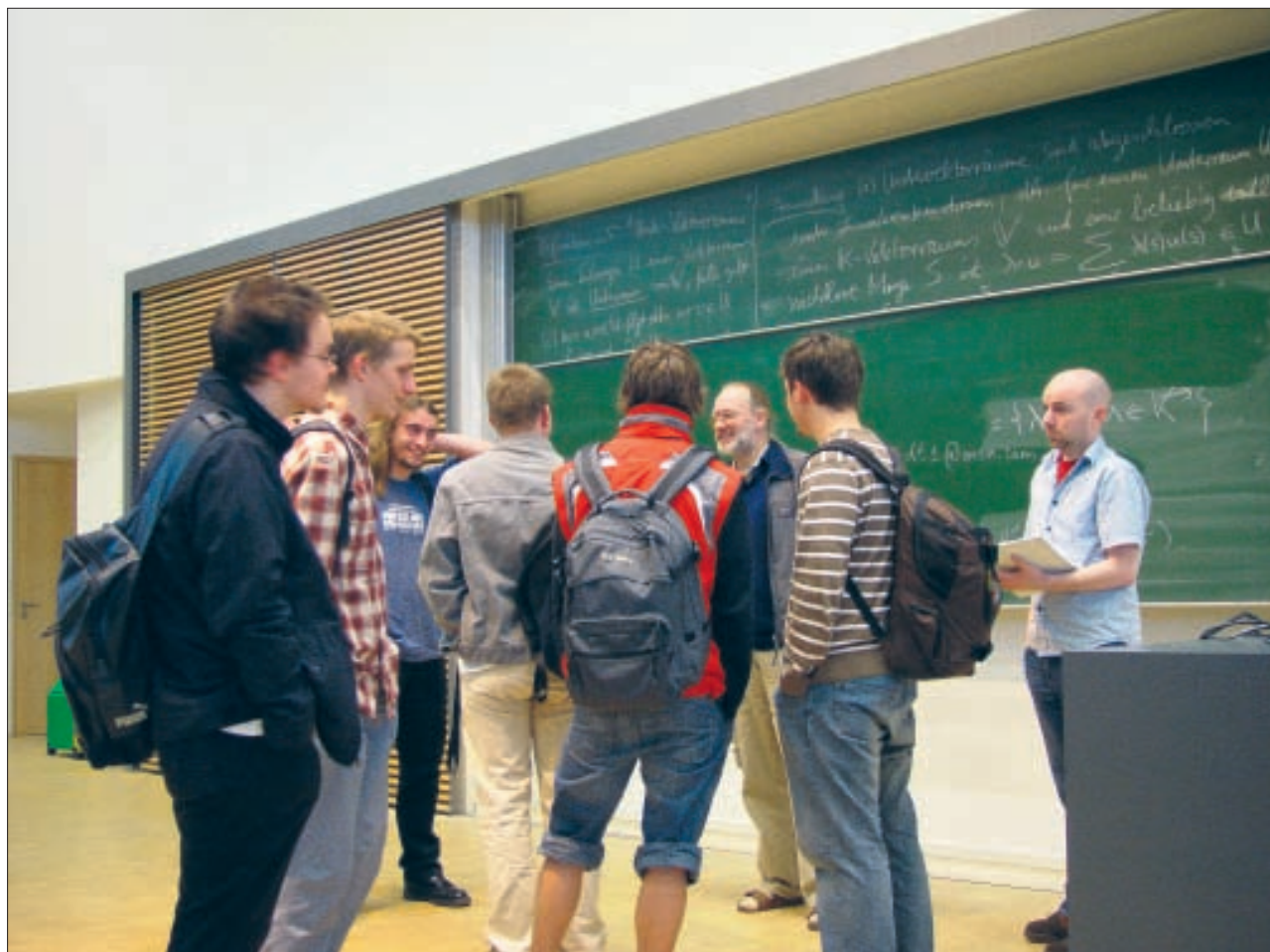
Gute Lehre ermöglicht und fördert das eigenständige Lernen der Studenten.

Die Qualität der Lehre ist für die TUD auch im Zusammenhang mit der Studienreform, die durch den Bologna-Prozess ausgelöst wurde, ein zentrales Anliegen. Im Zuge des Bologna-Prozesses sind Veränderungen von Lehre und Studium in Gang, die Bildung und Ausbildung an Hochschulen bis weit hinein in die Phase bis zur Promotion bewegen. Diese Reformen dürfen aber nicht auf eine Veränderung der Organisationsstrukturen und der Einführung formaler Regularien abzielen,