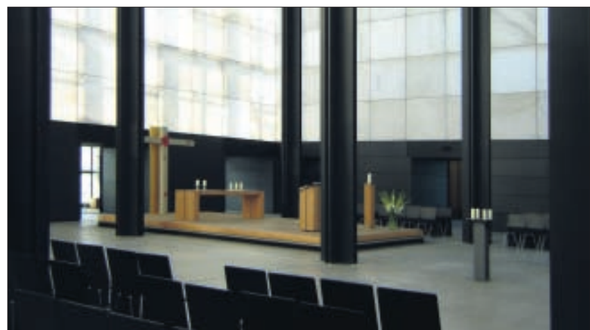
Eine Innenansicht des »Christus-Pavillons«.

Auch die neuen Stipendiatinnen haben schon Pläne, wie man zeitgenössische Kunst möglichst interessant in die Unterrichtsgestaltung einbinden könnte. »Wir wollen mit den Schülern zu akustischen Bildern arbeiten«, erklären Isabel Eisfeld