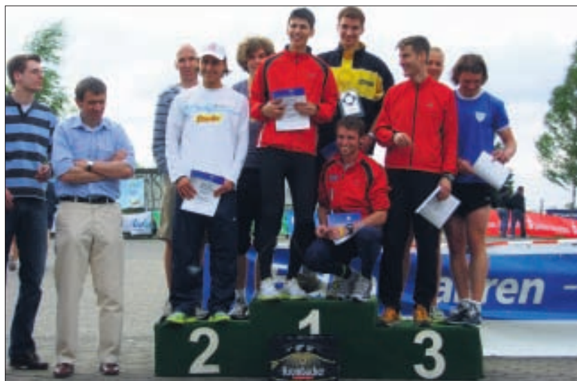
Die Siegerehrung bei den DHM in der Disziplin Mannschaft 10 km.