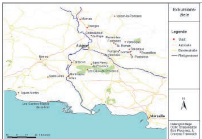
Die Karte zeigt die angesteuerten Ziele der Exkursion (abgesehen von Marseille, das nur der Orientierung halber eingetragen wurde). Karte: Frenzel

Der Autor studiert seit 2005 an der TU Dresden die Fächer Geschichte und Geographie (für das höhere Lehramt an Gymnasien).