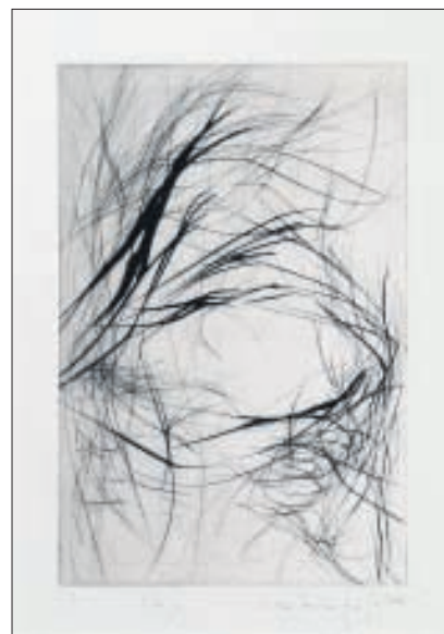
»Neige«, Kaltnadelradierung, 2008.

Werke von Kerstin Franke-Gneuß befinden sich im Angermuseum Erfurt, im Museum für zeitgenössische Kunst Chemnitz, im Kupferstich-Kabinett der Staatlichen Kunst-