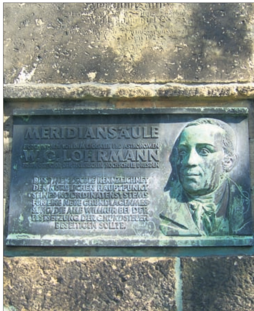
Die Gedenktafel der Säule erinnert an Lohrmann.