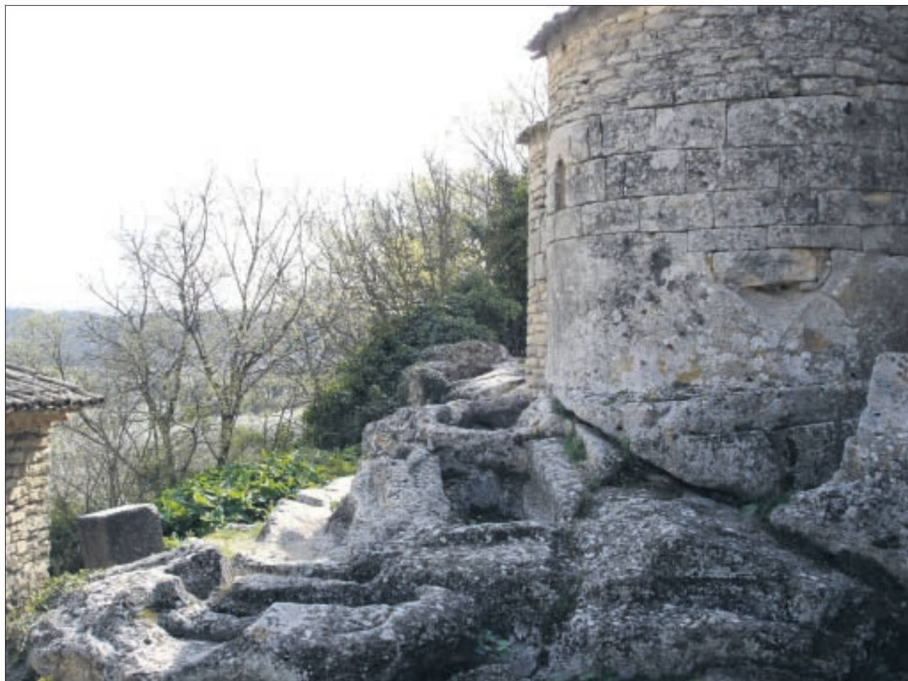
St. Pantaleon in der Nähe von Gordes, 2009.

Im Rückblick schildert er die Situation wie folgt: »Der Ort [Avignon] war zu dieser Zeit beengt, die Häuser unzureichend und von Bewohnern überquellend, so dass unsere Ältesten beschlossen, dass die Frauen mit den Kindern in einen nahegelegenen