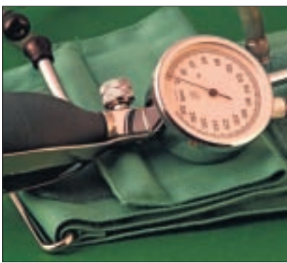
Bluthochdruck ist ein medizinisches Problem.