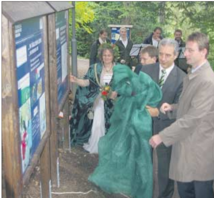
Erste Tafeln auf dem »Pfad der Nachhaltigkeit« werden begutachtet.

Der Begriff der Nachhaltigkeit ist untrennbar mit der Forstwirtschaft, Cotta und Tharandt verbunden. Erfunden hat ihn nicht weit von Tharandt der Sächsische Oberberghauptmann Hannß Carl von Carlowitz: er forderte 1713 in Freiberg, »... den Anbau des Holzes so anzustellen, dass es eine kontinuierliche, beständige und nachhaltige Nutzung gebe.« Das hat dann Cotta, der Begründer der Tharandter Einrichtung, erkannt und umgesetzt. So ist es bis heute oberstes Prinzip der Forstwirtschaft, die Wälder so zu nutzen, dass sie nachhaltig, also dauerhaft alle ihre Nutz-, Schutz- und Erholungsfunktionen erfüllen. Dieses Prinzip der Vorsorge für kommende Generationen spielt derzeit auch im öffentlichen Leben und der Politik eine zunehmende Rolle. Seit der Welt-Umweltkonferenz in Rio de Janeiro 1992 wird der Begriff der Nachhaltigkeit in allen Bereichen der Ökologie, Ökonomie und Gesellschaft verwendet. Der Forstgarten ist deshalb so gut für einen Pfad der Nachhaltigkeit geeignet, da er mit seinem alten, fast 200-