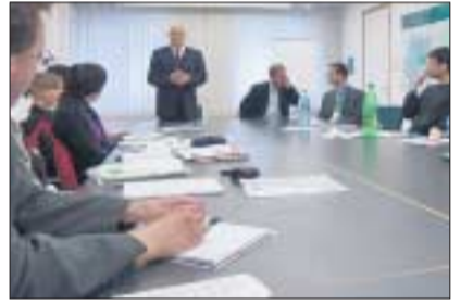
Politik zum Anfasseln: Studenten der TU Dresden diskutieren mit Jürgen Schröder, Abgeordneter im Europäischen Parlament.

40 Studenten aus der TU Dresden nahmen am 1. und 2. Juni 2006 am Workshop »Space Biology and Medicine« des Instituts für Luft- und Raumfahrttechnik teil. Wissenschaftler aus Deutschland und Russland informierten darüber, wie sich die Raumfahrt auf den menschlichen Körper auswirkt. Welche psychologischen Probleme treten bei Langzeitaufenthalten auf? Und wie lebt es sich auf einer Raumstation? Die Teilnehmer besuchten außerdem das Flugmedizinische Institut der Luftwaffe und erfuhren dort, wie und wo man trainieren muss, um in den Weltraum zu reisen.