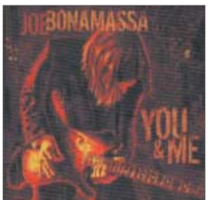
Joe Bonamassa: »You & Me« (2006), Prologue Records.

Und was meint mein kritischer CD-Player? Nichts – er lächelt. keck