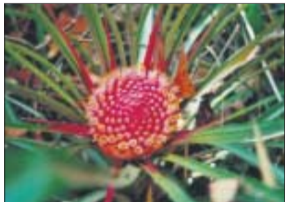
Ochagavia carnea (Bromelie).

Nachdem ich Chile bereits während eines Studentenaustausches kennengelernt hatte, bin ich für meine Promotion dorthin zurückgekehrt. Nach einer behutsamen Annäherung zog mich diese »senkrechte Welt«, wie Neruda sie nennt, in ihren Bann – mit Bäumen, die sich »erheben über den Teppich des schweigsamen Waldes, und jedes Laubwerk, länglich, gekräuselt, verzweigt, lanzettförmig hat einen anderen Stil, wie durch eine Schere mit endlosen Bewegungen geschnitten«. Mittelchile ist