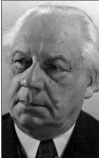
Professor Fedor Stepun.

Die Besonderheit der Tagung lag zunächst einmal institutionell darin, dass sie ein gemeinsames Projekt der Slavistik und einer internationalen Forschungsgruppe war, der Forschungsgruppe Russische Philosophie. Es kamen hier also philologische, literatur- und sprachwissenschaftliche Herangehensweisen mit speziell philosophischen und theologischen Fragestellungen zusammen. Vor allem aber zeichnete sich die Tagung dadurch aus, dass sie bei allem Interesse an den Personen problemorientiert war. Das Thema »Kultur als Dialog und Meinung« zielte auf eine grundsätzliche Behandlung der Fragen, wie Kultur entsteht, wie Kulturen bewertet und in Kulturen gewertet wird. Stepun und Frank waren hierin die entscheidenden Anreger. Beide sind Vertreter der Dialogphilosophie, wie sie zeitgleich etwa auch von Martin Buber vertreten wurde. Kultur als positives Ergebnis von Gespräch wurde zum Ideal gegenüber den Totalitarismen ihrer Zeit, die als kulturzerstörerische Verabsolutierung partikularer Meinungen und Interessen erkannt wurden. Während die Abgrenzung