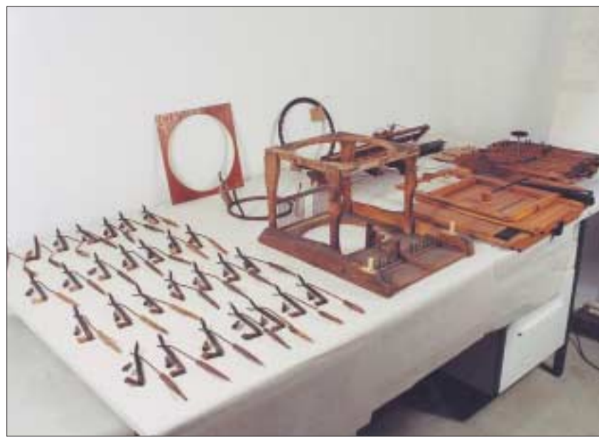
Das zur Untersuchung und Restaurierung demontierte Mitterhofer-Modell der TU Dresden.

Wie Zeitzeugen berichteten, sind in der Tat aus den Wanderer-Werken damals eine komplette Maschine sowie etliche ältere Einzelteile bzw. Baugruppen an die TH Dresden überführt worden, im Begleitschreiben ist sogar im Plural von Maschinen die Rede. Dies dürfte am Institut den Ehrgeiz geweckt haben, eine zweite Maschine aufzubauen bzw. zu komplettieren. Dazu wurden die Teile angepasst sowie kleinere und größere Ergänzungen vorgenommen. Heute würde man mit historischen Sachzeugen freilich restauratorisch sorgsamer umgehen. Immerhin hat das Vorgehen zum Erhalt der Bauteile geführt.