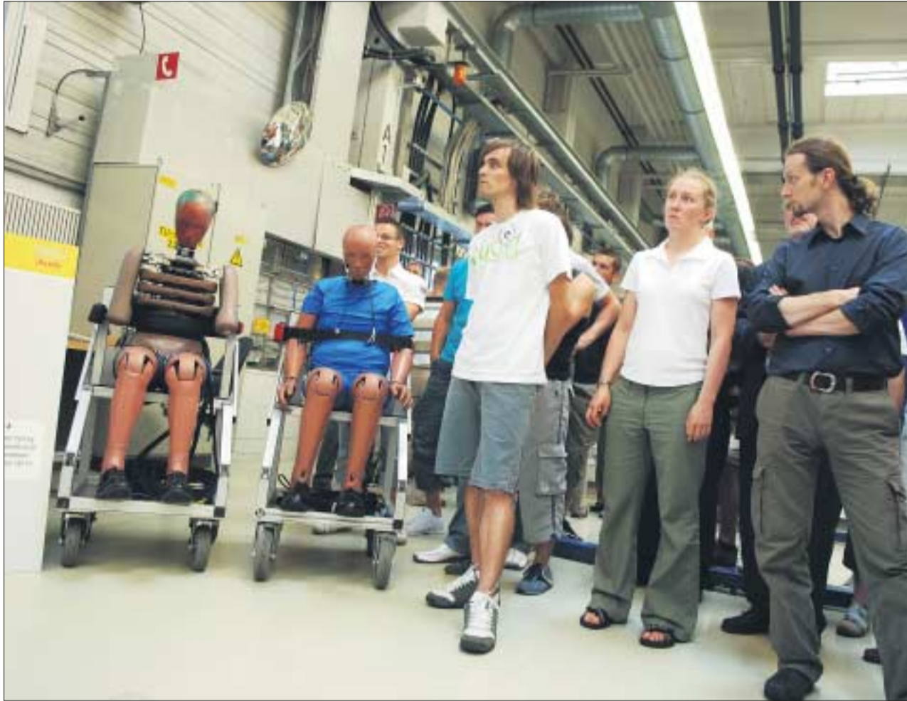
Beim Crashtest mochte keiner der Studenten mit den Dummies tauschen.

Dass sich die Audi-Modelle durch höchste Qualität auszeichnen, ist nicht zu-