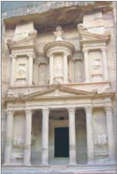
Die Khazne Firaun Fassade in Petra, die im Film »Indiana Jones III« zu medialer Berühmtheit gelangte.

Der erste Anlaufpunkt der Reise ist Amman, dessen Stadtbild geprägt ist von zugebauten Hügeln, unzähligen Autos und bunten Reklameschildern. Der alte Zitadellenhügel mit seinen Bauten aus römischer, byzantinischer und islamischer Zeit bietet