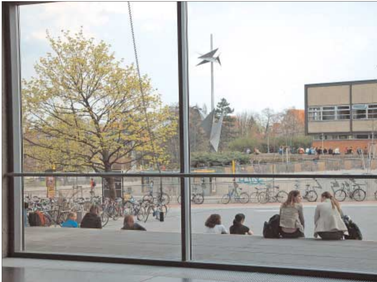
Die Ruhe vor dem Sturm? Laut Bildungsbericht droht Deutschland nach dem Jahr 2008 ein Studierendenberg, der sich allerdings, so prognostizieren Bildungsforscher, stärker in den westlichen Bundesländern zeigen wird.

Professor Wolter stellt einen weiteren Aspekt heraus: »Deutlicher als in vielen