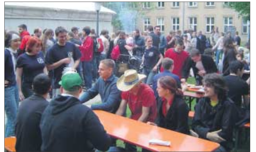
Mit Grillen und Rockmusik klang der Tag aus.

Die Sieger des Volleyballturniers (1. Platz: Kampfpinguine, 2. Platz: 2Promille-