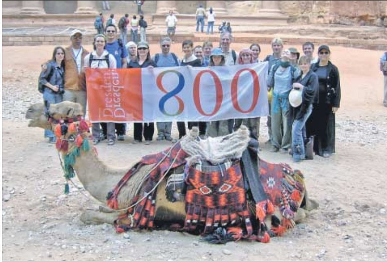
Aus dem 800 Jahre alten Dresden in die antike Stadt Petra: die Exkursionsteilnehmer mit einem Transparentgruß auf dem Höhepunkt ihrer unvergesslichen Reise nach Jordanien.

einen imposanten Blick auf das alte Theater, welches einst zirka 6000 Zuschauern Platz bot und heute zu den besterhaltenen Theatern der griechisch-römischen Welt zählt.