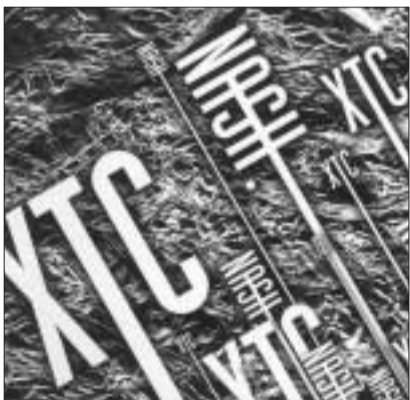
Nash:XTC, 2006 (Underwater).

»XTC« ist die mittlerweile vierte CD der Dresdner Band Nash und meine ganz persönliche Lieblingsplatte. In sieben Songs rocken die vier Jungs auch zu sanften Tönen und holten sich für »Losing the fight« Unterstützung vom Dresdner Knabenchor. Am 1. April stellte die Band ihr neues Werk in der Scheune vor. Mit auf der Bühne das Dresdner Elbflorenz Ensemble – Rock und sanfte Saiten, eine tolle Kombination. Auf