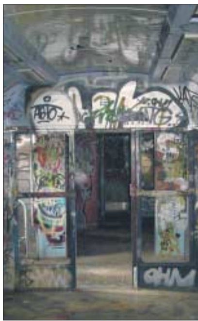
Sind Graffiti urheberrechtlich geschützt? Eine knifflige rechtliche Frage.

Im Rahmen des Veranstaltungsprogramms der »Stadt der Wissenschaft 2006« kann man sich noch bis zum 30. Juni 2006 im von-Gerber-Bau (Bergstr. 53) über den Schutz des geistigen Eigentums informieren. Die Ausstellung »Kunsträume – Rechtsräume« des Instituts für Geistiges Eigentum, Wettbewerbs- und Medienrecht (IGEWEM) umfasst besondere Aspekte des Urheberrechts sowie des Patent- und Markenrechts. In der »Langen Nacht der Wissenschaften«, am 30. Juni, findet um 20