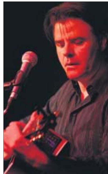
IC Falkenberg stellte den Dresdnern sein neues Album »Schwimmen im Regen« vor dem offiziellen Erscheinungsdatum vor.

(lacht) ... ich auch nicht, obwohl ... Stern Meißen in der Ära ihrer Art-Rock-Zeit, das hatte schon viel mit Jazz, mit Jazzrock zu tun ... Bayon eigentlich auch. Also wenn man es fachlich abklopft, ist es eigentlich nicht so weit hergeholt.