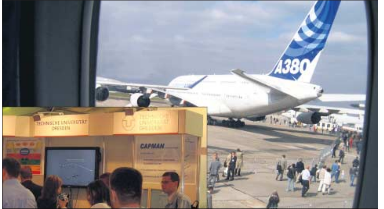
Blick aus der Kabine einer Tupolev TU-204 auf den Airbus A380 und als kleines Bild der Stand der TU Dresden.

Das Fraunhofer-Institut für Werkstoff- und Strahltechnik (IWS) Dresden konnte auf der ILA die im A380 angewandte Technologie des Laserstrahlsschweißens vorstellen. Dieses Fügeverfahren ermöglicht es, die Nietverbindungen von Versteifungselementen in Rumpfstrukturen zu ersetzen. Neben Gewichtsreduktion induziert dies in erster