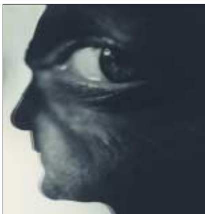
Edmund Kesting: Kopf im Profil. Um 1957, Silbergelatineabzug, Kupferstich-Kabinett Dresden (Ausschnitt).

»Nachbilder. Photographie in der DDR« heißt ein zweitägiges Kolloquium im Vortragsaal der Sächsischen Landesbibliothek – Staats- und Universitätsbibliothek Dresden. Am 23. und 24. Juni 2006 werden sich deutsche und internationale Wissenschaftler mit Vergangenheit und Gegenwart von Bildwelten der DDR auseinandersetzen. Das Symposium wird unter anderem von der Deutschen Gesellschaft für Photographie veranstaltet. Parallel zeigt das Kupferstichkabinett noch bis 28. August 2006 eine Ausstellung »Mensch! Photographien aus Dresdner Sammlungen«. ke