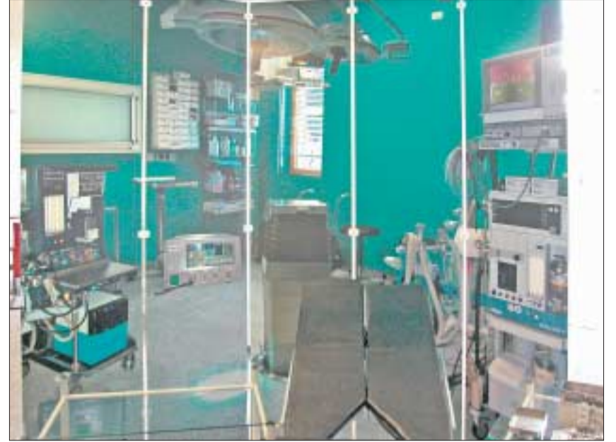
OP-Szene mit Geräten aus der Sammlung des Instituts für Medizin der TU Dresden und der Historischen Sammlungen im Gesundheitspark Bad Gottleuba.