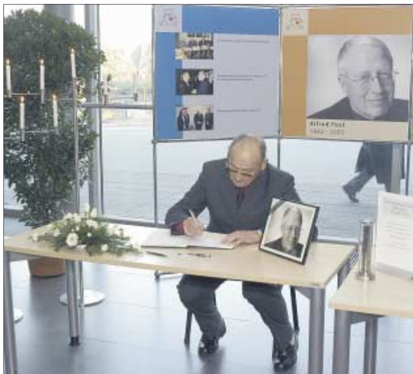
Im Foyer des Hörsaalzentrums war es möglich, sich in ein Kondolenzbuch einzutragen.