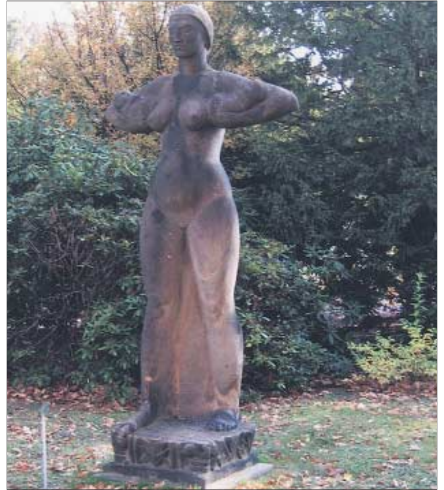
Ludwig Godenschweg »Mutter mit Kindern«.

Die Plastik »Mutter mit Kindern« wurde über eine lange Zeitstrecke als Schöpfung des Dresdner Künstlers Richard Guhr eingeordnet, der den Dresdnern als Schöpfer des Rathausmannes geläufig ist. Die Dresdner Kunsthistorikerin Sigrid Walther-Goltzsche klärte in den 80er Jahren, dass es sich um eine Schöpfung des Dresdner Bildhauers Ludwig Godenschweg handelt, für die der Künstler 1920 den Sächsischen Staatspreis erhalten hatte. Sie sollte in dieser Zeit auf dem Palaisplatz am Japanischen Palais aufgestellt werden. Dieser Standort wurde nicht befürwortet und die Plastik wurde dem Stadt Krankenhaus Johannstadt übergeben, wo sie im Innenhof zwischen den beiden Bettenhäusern der damaligen Klinik für Chirurgie (heute Haus 7 und 9) aufgestellt wurde. Nach dem Kriegsende wurde sie in die Nähe der Frauenklinik umgesetzt und ältere Mitarbeiter des Klinikums werden sich erinnern, dass die Mutter mit zwei Kindern auf ihren ausgestreckten Armen zwischen dem Gebäude der ehemaligen Frauenklinik, Haus E und der damaligen Kinderkrippe/Kindergarten der Medizinischen Akademie gestanden hat. Mit dem Beginn des Baus des neuen Herzklinikums musste die Plastik gesichert werden und wurde nach einem erneuten Standortwechsel in den Gartenbereich vor der Orthopädischen Klinik umgesetzt, bis sie ungefähr im Jahr 2000,