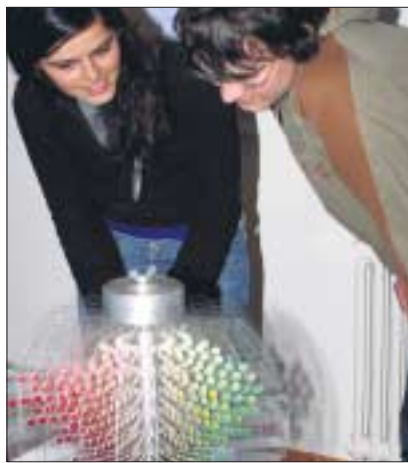
Farbenkörper zur DIN 6164 (Manfred Richter, 1962).

siologe Ewald Hering und der Baumeister Gottfried Semper. Herausragendes leistete zudem der Universalgelehrte und Nobelpreisträger Wilhelm Ostwald zu Beginn des vergangenen Jahrhunderts in Leipzig bzw. als freier Forscher in Grossbothen bei Leipzig. Er widmete sich über 20 Jahre intensiv der Farbwissenschaft und übte einen nachhaltigen Einfluss auf die Entwicklung der modernen, quantitativen Farbenlehre und -normung aus. Auch verweist Bendin gern auf den gebürtigen Dresdner Farbwissenschaftler Manfred Richter, der – einst als »deutscher Farbenpapst« bezeichnet – eine umfangreiche Bibliographie zur Farbenlehre sowie das visuell gleichabständige Farbsystem DIN 6164 erarbeitete. Auf ihn geht auch die Gründung der heutigen »Deutschen farbwissenschaftlichen Gesellschaft« zurück. Mit der entsprechenden Aufarbeitung jener und anderer Leistungen im mitteldeutschen Raum soll die neue TU-Sammlung zur Farbenlehre zu einem wichtigen Bindeglied werden zwischen der »Historischen Farbstoffsammlung« am In-