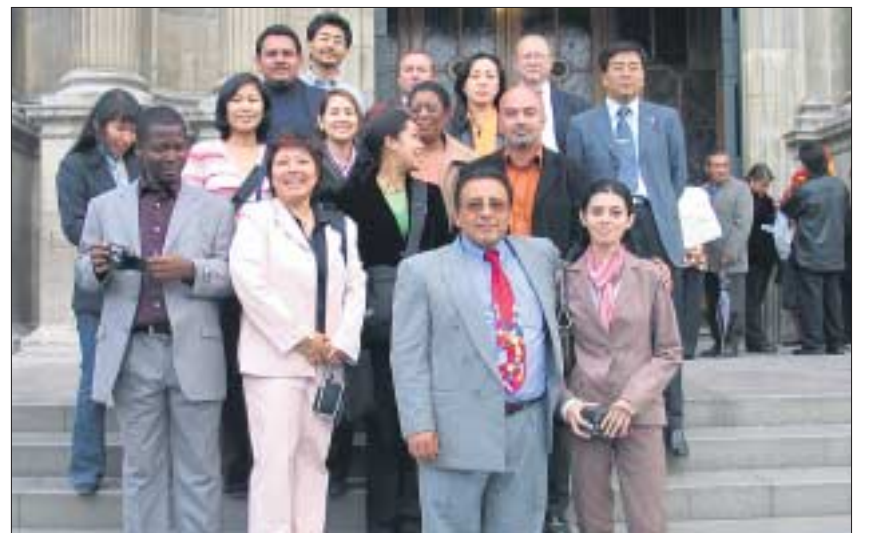
Teilnehmer aus zwölf Staaten Lateinamerikas, Afrikas und Asiens nahmen am Workshop in Bolivien teil.

Die Ziele der Alumni-Aktivitäten sind differenziert. Prinzipiell besteht das Hauptanliegen darin, die ehemaligen Absolventen wissenschaftlich nachzubetreuen, sie durch regelmäßige Fortbildungsmaßnah-