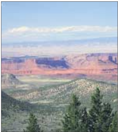
Blick aus dem Wald in die Wüste, La Sal Mountains, Utah.