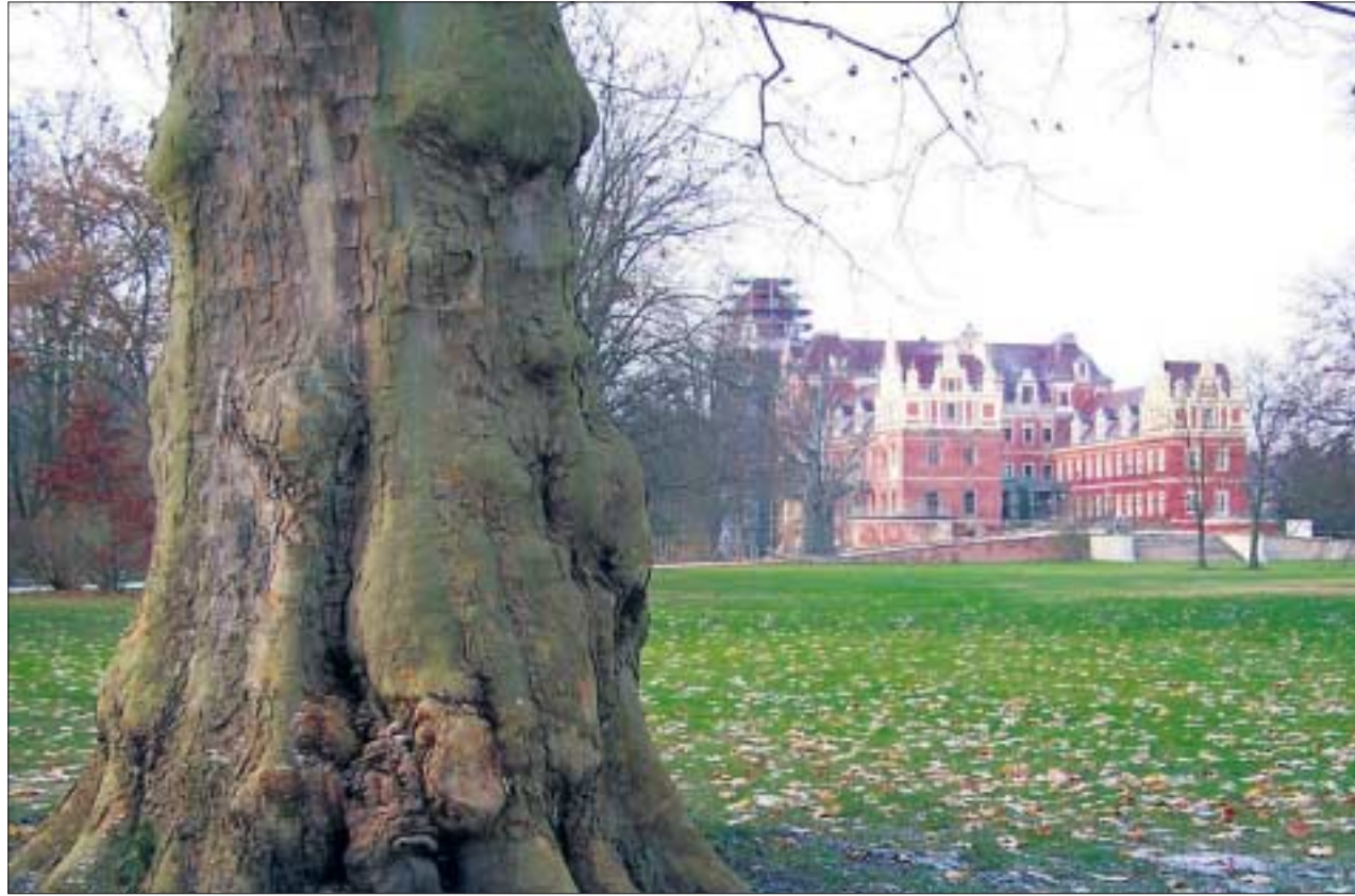
Der von Hermann Fürst von Pückler-Muskau ab 1815 angelegte Landschaftsgarten in Bad Muskau bot mit der im Neuen Schloss untergebrachten Muskauer Schule hervorragende Bedingungen und Inspiration für die Beantwortung gartenhistorischer Fragestellungen.

Diese Bezüge zu Pückler waren Thema der vier Vorträge internationaler Referenten am folgenden Vormittag. Im Anschluss daran trafen sich die 35 Teilnehmer, dar-