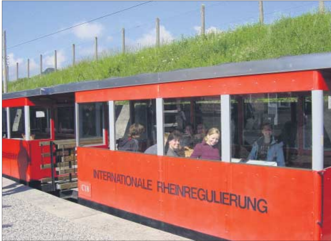
Eine Schmalspurbahn, früher für den Transport von Baumaterial genutzt, brachte die Studenten zur neuen Mündung des Alpenrheins. Nebenher gab es Informationen zur Geschichte der Rheinregulierung.

großen Augen bestaunte Kristallkluft. Nach kurzem Halt in Gletsch, am obersten Pegel der Rhone, endete dieser Tag in Sion, im französisch-sprachigen Wallis, wo wir unser Nachtlager für drei Nächte aufschlugen. Am nächsten Tag fand eine Exkursion zu den Kraftwerksanlagen der Grande Dixence statt. Nach einer Führung durch das zurzeit stillgelegte Kraftwerk ging es zu einem der Höhepunkte der Exkursion, der größten Gewichtsstaumauer der Welt. Diese ist 285 m hoch, 695 m lang und am Mauerfuß 197,6 m breit. Durch sie wird eine Speicherung von 400 Mio m 3 Wasser ermöglicht. Auf der Rückfahrt zur Jugendherberge nach Sion konnte noch eine geologische Besonderheit, die Erdpyramiden von Euseigne, bewundert werden.