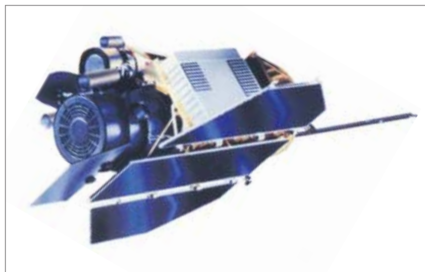
Der Röntgensatellit ROSAT forscht seit 1990 nach kosmischen Röntgenstrahlen in den unendlichen Weiten des Alls.

Am 13. Dezember, ab 17 Uhr, wird die Ausstellung »Begegnungen« im Hörsaal 02 im HSZ eröffnet