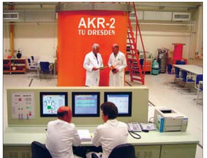
Ein Schmuckstück für Lehre und Forschung: der neue AKR-2.

Die neue Anlage löst den AKR-1 ab, der von Juli 1978 bis März 2004 mit einer sehr erfolgreichen Bilanz in Betrieb war. Der