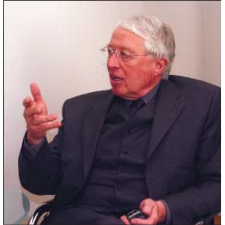
»Warten bringt nichts, wenn man weiß, was man will.«