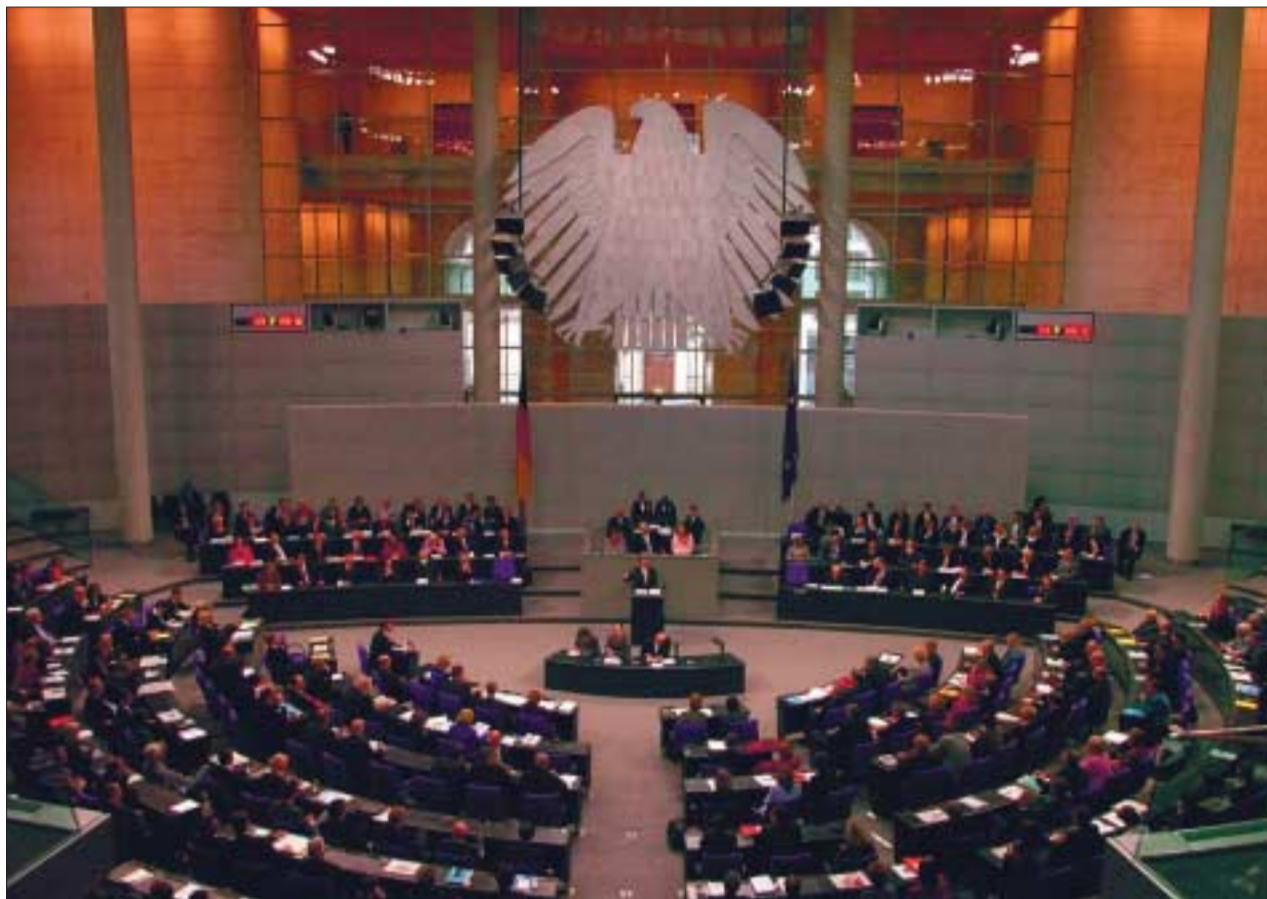
Immer wieder diskutiert: Die Mitglieder des Bundestages erhalten Diäten und haben meist noch »Nebenjobs«.

Die modernen Parlamente gehen auf die Ständeversammlungen zurück. Die dort für einige Wochen oder Monate auftretenden Adligen und Prälaten oder angesehenen Städtevertreter nahmen diese Aufgaben ehrenamtlich wahr und waren dafür auch reich genug. Im Frühparlamentarismus nach der Französischen Revolution war das Wahlrecht dann nach dem Einkommen gestaffelt, so dass ohnehin nur relativ wohlhabende Leute in die Parlamente gelangten, die sich ihr Mandat ebenfalls gut leisten konnten. Vor allem aber waren die Sitzungszeiten von Parlamenten im Vergleich zu heute kurz, so dass die Vereinbarkeit von Mandat und Beruf zumindest für jene kein Thema war,