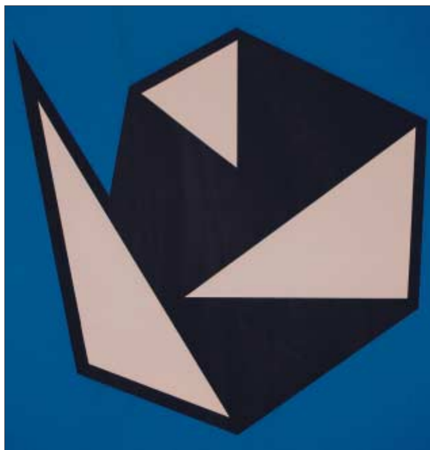
Hermann Glöckner (1889–1987): »Ohne Titel«, Farbsiebdruck, 1981