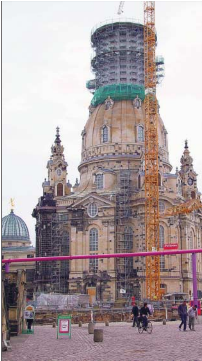
Die Aufnahme der Frauenkirche aus dem Jahr 2004 zeigt, wie die wieder vollendete Kuppel auf dem »Kuppelhals« ruht.

Die Baustatik ist fasziniert von der Konstruktionsidee George Bährs, wie sie von ihm selbst in seinem Gutachten vom 4. August 1733 ausführlich beschrieben worden ist. Es ist seine Vision einer glockenförmigen, reinen Steinkuppel, deren Tragfähigkeit allerdings erst mit Methoden der heutigen Baustatik überprüft und bestätigt werden konnte. George Bähr hatte sich vorgestellt, das gesamte Eigengewicht der Kuppel sei »im centrum gravitatis« vereinigt und verteile sich von dort aus »gar viele Mal« (also gleichmäßig) über die