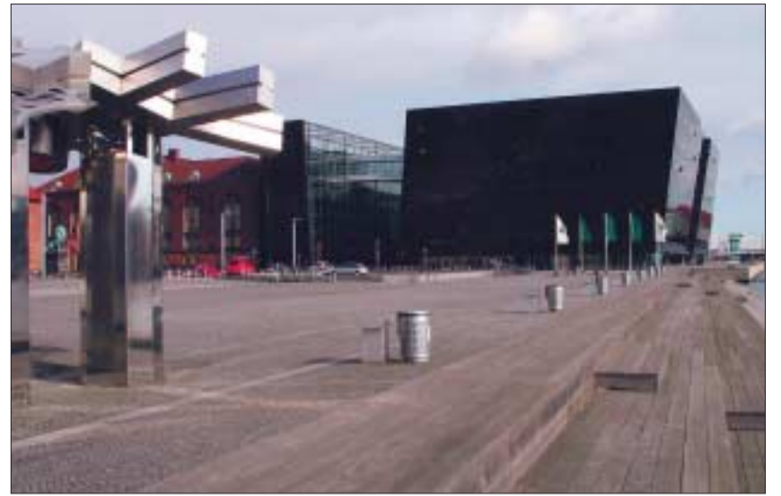
Der »Schwarze Diamant« – Gebäude der Königlichen Bibliothek und des Nationalen Fotomuseums Dänemark.

Die Ausstellung im »Schwarzen Diamanten«, dem modernen Domizil der Königlichen Bibliothek, unternimmt den Versuch, diese Landschaftsreise aus der Sicht