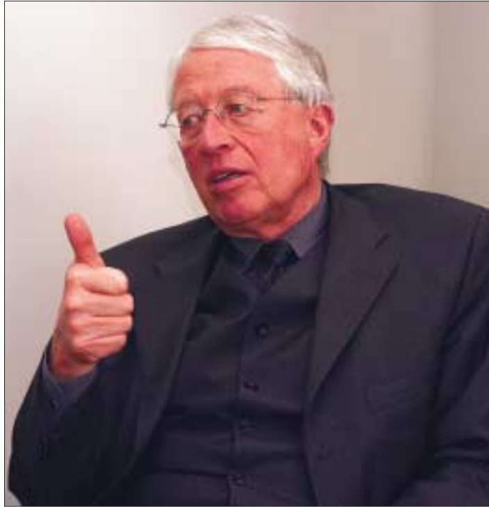
»... bis zum 1. Januar 2006 geschafft haben, denn ...«