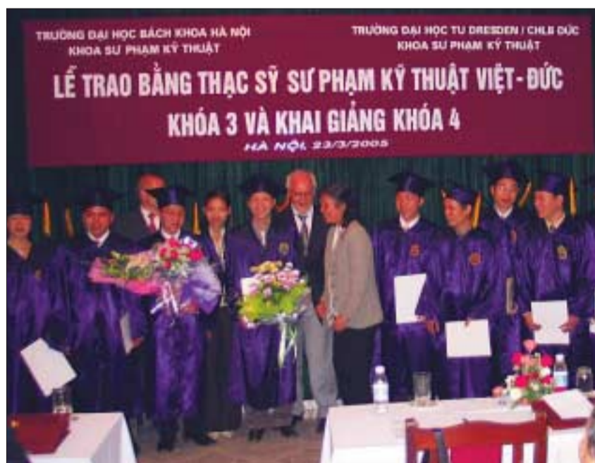
Dank des Aufbaustudienganges »Berufspädagogik« ist das Berufsbildungssystem Vietnams nun um elf dringend benötigte Absolventen reicher.

Der viersemestrige Aufbaustudiengang »Berufspädagogik« wird seit Oktober 1999 gemeinsam vom Institut für Berufspädagogik der Technischen Universität Dresden und der Faculty of Engineering Education der Hanoi University of Technology durchgeführt. Die Studenten des Aufbaustudienganges, überwiegend Referenten von Mini-