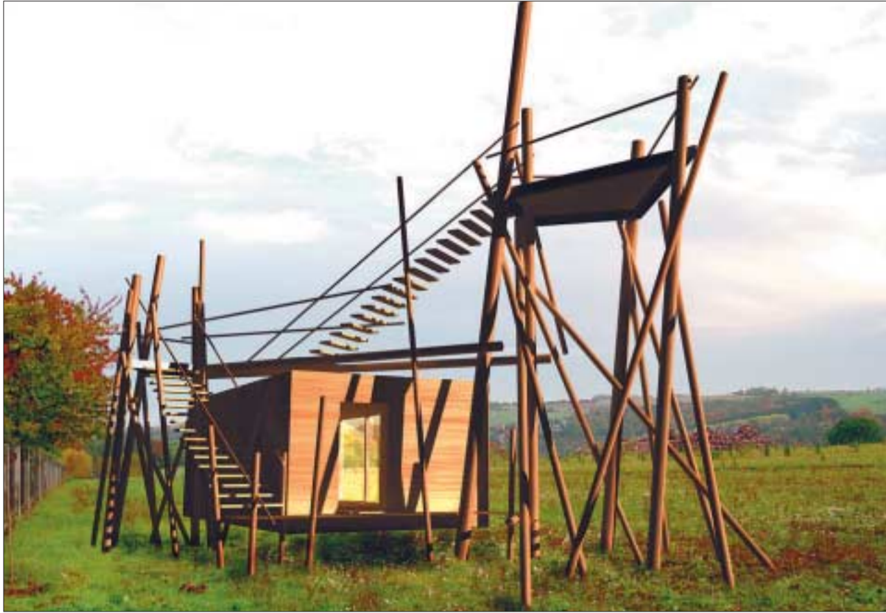
Nach den Vorstellungen Dresdner Architekturstudenten sollen Schutzhütte und Aussichtsplattform im Forstpark Tharandt »quasi-chaotisch« wirken. Grafik: arbex