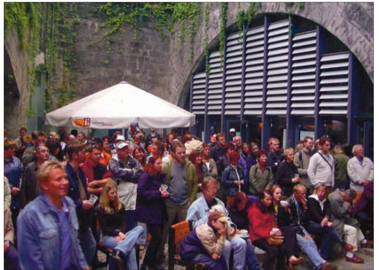
Bald mit Schallschutzdach? – Der Hofbereich des Bärenzwingers ist als Veranstaltungsort nicht wegzudenken.