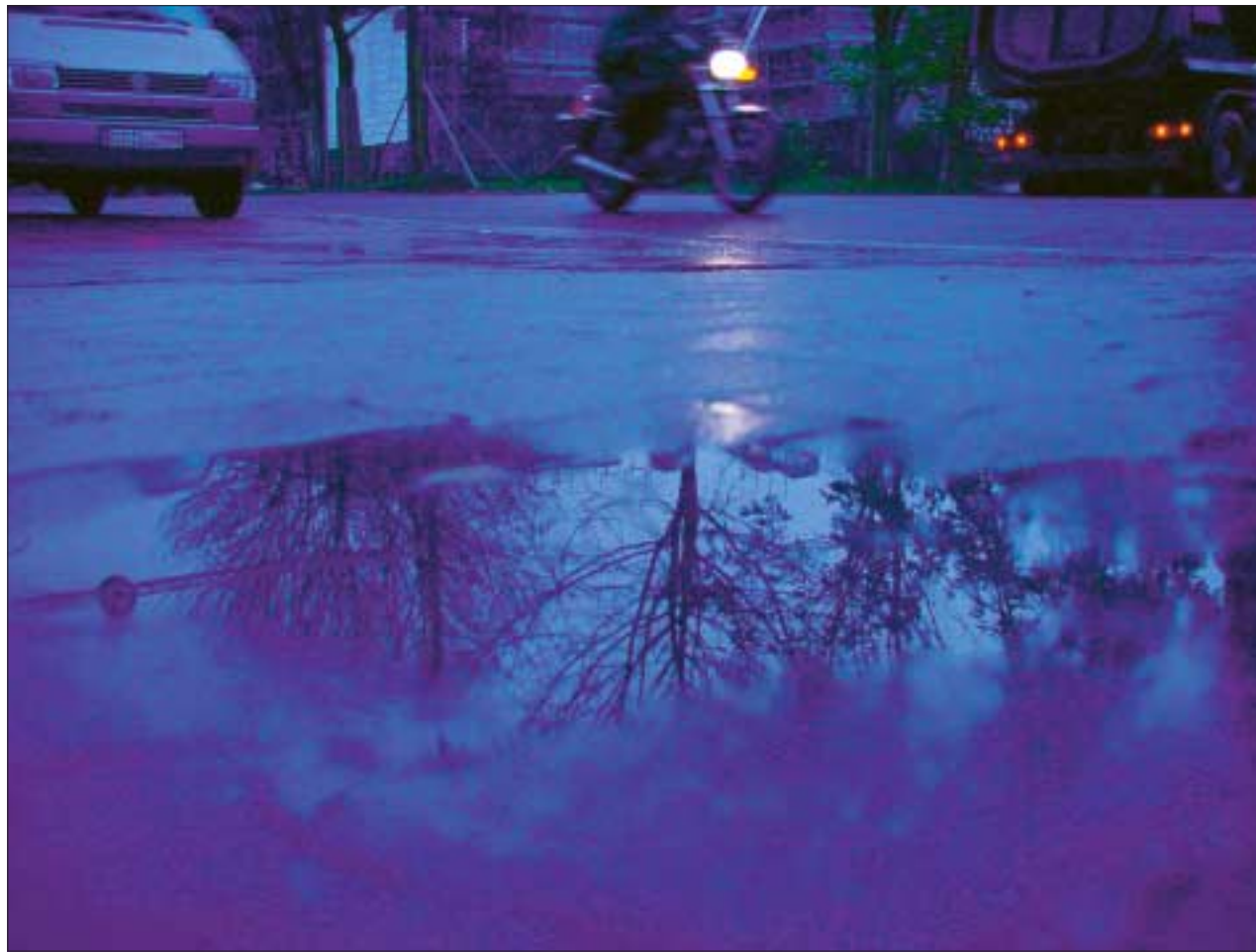
Nass und kalt, früh ist es auf dem Weg zur Arbeit noch dunkel, auf dem Heimweg ist es schon wieder finster. Was manche nur zum Schulterzucken veranlasst, bereitet jedem zehnten Dresdner gesundheitliche Probleme.

Seit vielen Jahren ist den Wissenschaftlern eine besondere Form der Depression bekannt, die besonders in der jetzt wieder anbrechenden kalten und dunklen Jahreszeit auftritt: Die saisonale oder Winterdepression. Man schätzt, dass bis zu fünf Prozent der Bevölkerung unter dieser speziellen Form der Depression leiden. Bei diesen Menschen treten die Symptome die-