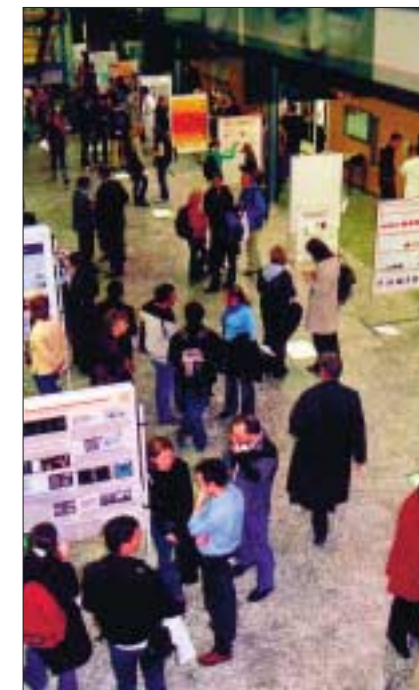
Die Posterdemonstrationen boten Infos zur Forschungsarbeit fast aller Kliniken und Institute.