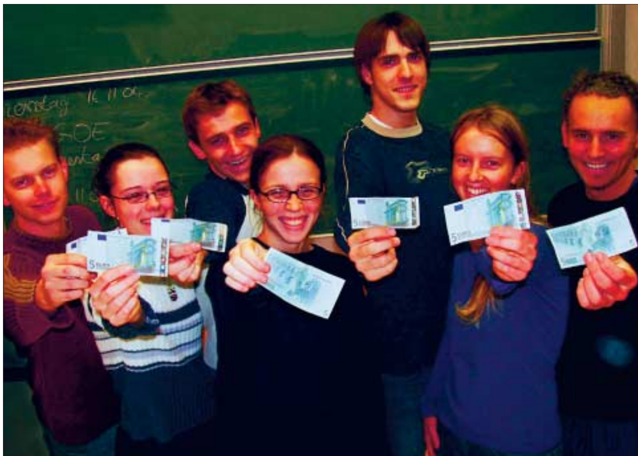
Aus fünf Euro Startkapital bis Weihnachten eine gewinnbringende Geschäftsidee zu entwickeln, lautet die Aufgabe für neu gegründete Studentenfirmen.