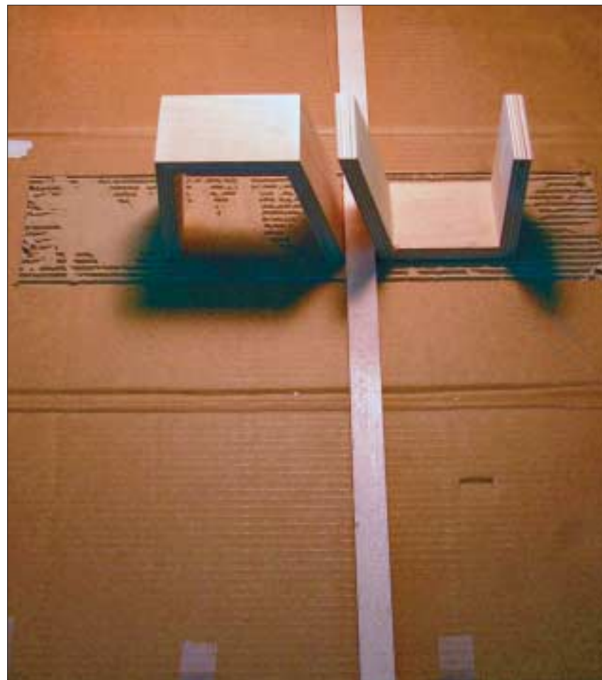
Eines der Modelle, über das sich die TUD-Studenten mit ihren amerikanischen Kommilitonen per Videokonferenz austauschten.

Erfahrungen der amerikanischen Studenten, die den Kalten Krieg in erster Linie mit Vietnam- und Koreakrieg verbinden, mit einfließt.« Austauschen konnten sich die Studenten über ein Weblog, ein Forum, um Bilder, Zeichnungen und Texte sich gegenseitig zugänglich zu machen und zu kommentieren. Kulturelle Unterschiede kamen bei dieser Zusammenarbeit natürlich auch zu Tage. Die klare deutsche Art zu kritisieren führt da schon mal zu Verstimmungen, wie auch das amerikanische »Everything is brilliant (alles ist ganz toll)« die Dresdner Studenten zuweilen ratlos lässt. An diesem Abend präsentieren die einzelnen Projektgruppen nun die Ergebnisse: Betonformen, die sich bedrohlich über den Fußgänger erheben; Mauerteile, die wieder aufgestellt werden; eine symbolisch beleuchtete Grenze; eine Zeit-