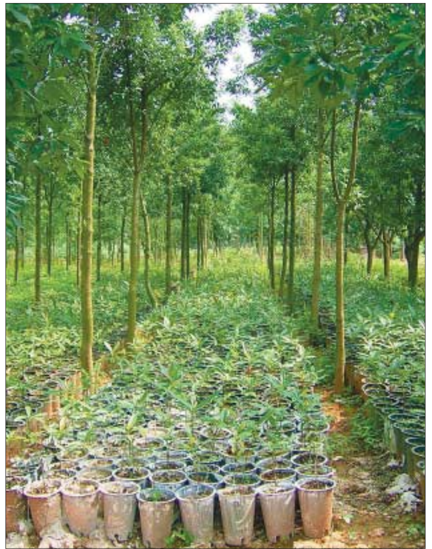
Pflanzenaufzucht für Aufforstungsprojekte. Die kleinen getopften Magnolien werden später dazu verwendet, um Kieferbestände zu unterpflanzen. Damit wird der Laubbaumanteil in Nadelholzarealen erhöht.

Was können deutsche Erfahrungen nützen? Ich denke aus der langfristigen Erfahrung mit einer nachhaltigen und auf viele gesellschaftliche Funktionen ausgerichteten Forstwirtschaft können wir in China zu einer besser strukturierten Aufforstungsstrategie auf Landschaftsebene beitragen.