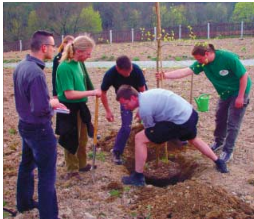
Tharandter Studenten vom Cotta-Club pflanzen eine Virginische Hopfenbuche in das Quartier der Buchen-Zucker-Ahorn-Wälder.

Noch in diesem Jahr soll der Bau des wohl spektakulärsten Bauwerkes im Zusammenhang mit dem Erweiterungsprojekt beginnen – eine 120 m lange Holzbrücke über die Freiburger Straße, die die beiden Teile des Sächsischen Landesarboretums miteinander verbindet. Während die Finanzierung der Teiche, der Gebirge und der Brücke weitestgehend durch die