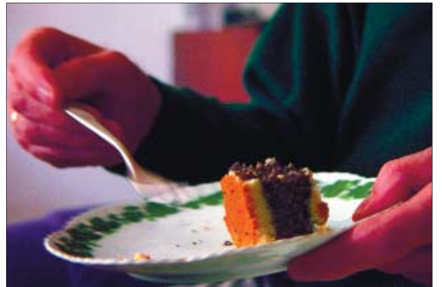
Das Parkinson-Handzittern macht selbst das Essen zum Balanceakt.

Welche Kongress-Erkenntnisse sind aus Ihrer Sicht beispielsweise für den Hausarzt oder einen nicht in der Forschung tätigen Mediziner oder aber auch für Betroffene von Bedeutung?