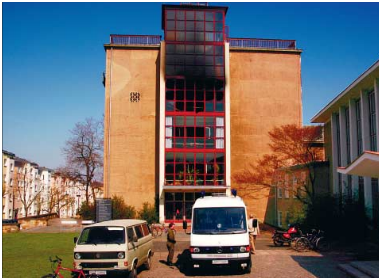
Am 16. April schlugen Flammen aus der dritten Etage des Eingangsgebäudes zum Barkhausen-Bau Georg-Schumann-Straße/Ecke Nöthnitzer Straße (hier ein Foto vom darauf folgenden Donnerstagvormittag).

Unabhängig davon, ob und wem persönliches Versagen vorzuwerfen ist, sollte dieses Ereignis Anlass genug sein, dass insbesondere jeder Vorgesetzte, aber auch alle anderen Mitarbeiter und Mitarbeiterinnen der TU Schwachstellen in ihren Bereichen ermitteln, die im Ernstfall zu Gefahren werden können. Denn oft haben wir bisher nur Glück gehabt, wenn trotz übersehener