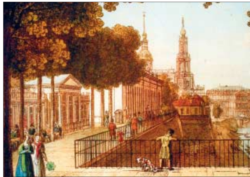
Pavillon der »Technischen Bildungsanstalt« in Blickachse zur Hofkirche.

dung, skizzierte er und sorgte auch für Details der Ausstattung wie ein System von »Sprachröhren zur Korrespondenz im Inneren des Schulgebäudes« – ein klassischer Ingenieur. Vorstöße in gleicher Richtung von Lohrmann gemeinsam mit von Schlieben 1822 und einer Kommerzien- deputation 1824 waren unter Friedrich August I. noch zurückgewiesen worden. Die richtunggebenden Gedanken der Blochmannschen Denkschrift fanden dann 1827 Beifall und brachten den Gründungsbeschluss der sächsischen Staatsregierung nun unter König Anton. Am 1. Mai 1828 öffneten sich zur feierlichen Einweihung mit Staatsminister Graf von Einsiedel die Tore der Technischen Bildungsanstalt in einem aus der Brühlschen Zeit stammenden Pavillon auf der »Terrasse«. Aus den wenigen Räumen dort, vornehmlich für