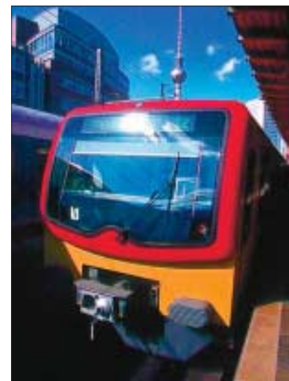
Mit spezieller Software können 40 Prozent der Instandhaltungskosten eingespart und der spezifische Energieverbrauch auf 60 Prozent des bisherigen Wertes gesenkt werden.

Dies und noch vieles mehr ermöglichen innovative Produkte aus dem Forschungsprojekt intermobil Region Dresden. Inter mobil ist eines von fünf Leitprojekten im Rahmen des BMBF-Forschungsprogramms »Nachhaltige Mobilität in Ballungsräumen«. Ziel ist es, mit innovativen Technologien und intelligentem Verkehrsmanagement die Effizienz und Flexibilität der Verkehrssysteme zu erhöhen sowie zur Ver-