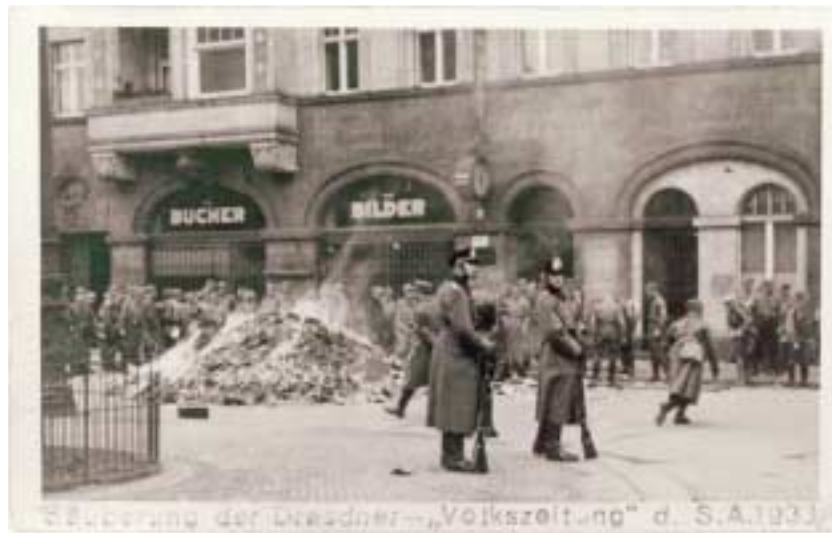
Bücherverbrennung durch die Faschisten in Dresden vor dem Gebäude der Dresdner Volkszeitung und des Verlages Kaden & Co., Wettiner Platz, 8.3.1933. Fotografie, 8x12,8 cm Dresden; Museum für Geschichte

Vorbereitung und Regie über den Ablauf der Bücherverbrennung lagen in den Händen des »Hauptamtes für Aufklärung und Werbung« der Studentenschaft der TH Dresden. Wie angekündigt nahmen am Abend des 10. Mai 1933 im Großen Saal des Studentenhauses Kommilitonen in SA- und SS-Uniformen Aufstellung. Ebenso waren der Rektor, eine große Zahl Professoren, Abgesandte von Behörden und der Presse erschienen, als der Gauobmann des NS-Reichsverbandes Deutscher Schriftsteller Will Vesper (1882-1962) über die »Zeitenwende in der Dichtung«