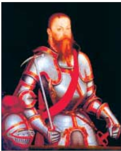
Herzog Moritz von Sachsen evakuierte Leipzigs Studenten nach Meißner.