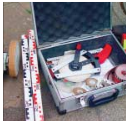
Maßband, Streckenzähler und Meßmarken gehören u.a. zur Ausrüstung der Unfallforscher.