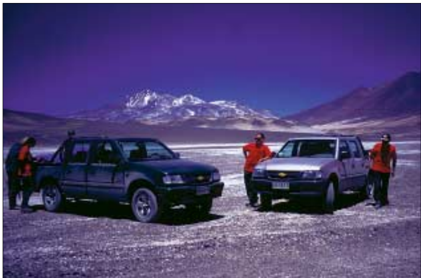
Unterwegs: Offroader sind unabdingbar!