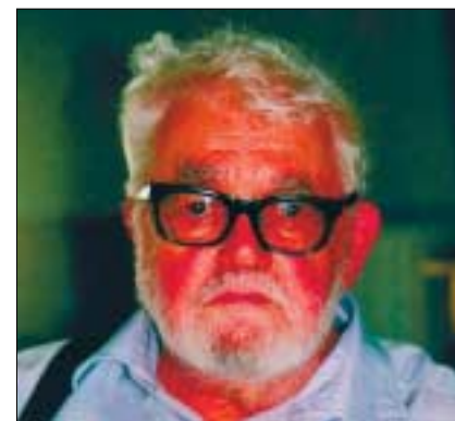
John McCarthy.

Am Montag, 17. Juni 2002 stattete Professor John McCarthy von der Stanford Universität der TU Dresden bereits zum zweiten Mal einen Besuch ab. John McCarthy ist einer der »großen alten Männer« der Informatik, zu der er sowohl theoretische und praktische Beiträge geliefert hat. Insbesondere hat er sich um die Entwicklung der grundlegenden Ideen der »Symbolic Computation« (nichtnumerische Computer-Anwendungen) verdient gemacht. Mit gutem Recht kann er der Begründer der »Künstlichen Intelligenz« (KI) genannt werden, zu deren bedeutendsten Forschern er gehört.