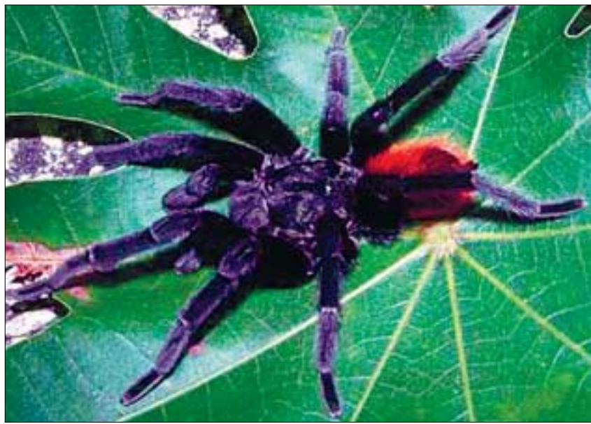
Viele Menschen leiden unter der Angst vor Spinnen, die eigentlich nicht besonders gefährlich sind. Manchmal sind diese Ängste so stark, dass die Betroffenen dadurch in ihrem Leben stark beeinträchtigt werden.