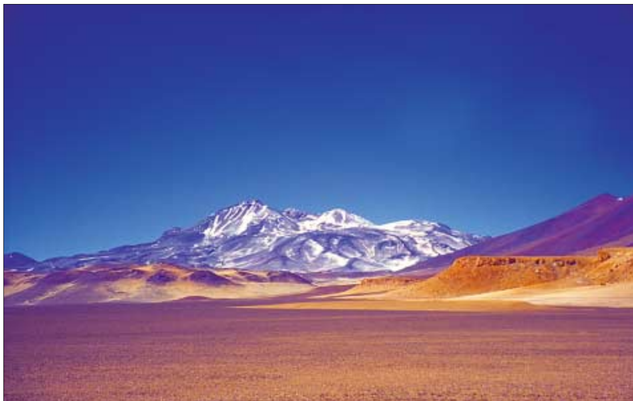
Der Ojos del Salado ist mit 6893 Metern der höchste Vulkan der Welt.

Nun gibt es aber von der Gegend, wie generell von Südamerika, nur wenig Kartenmaterial. Was auf chilenischer wie argentinischer Seite vorhanden ist, weist meist einen Maßstab von 1:50 000 und eine Datierung von Mitte der 60er Jahre auf. Zudem ist das Material für die Öffentlichkeit nur schwer zugänglich, da es größtenteils militärischer Geheimhaltung unterliegt. Die Situation veranlasste den Deutschen Alpenverein, der als größter