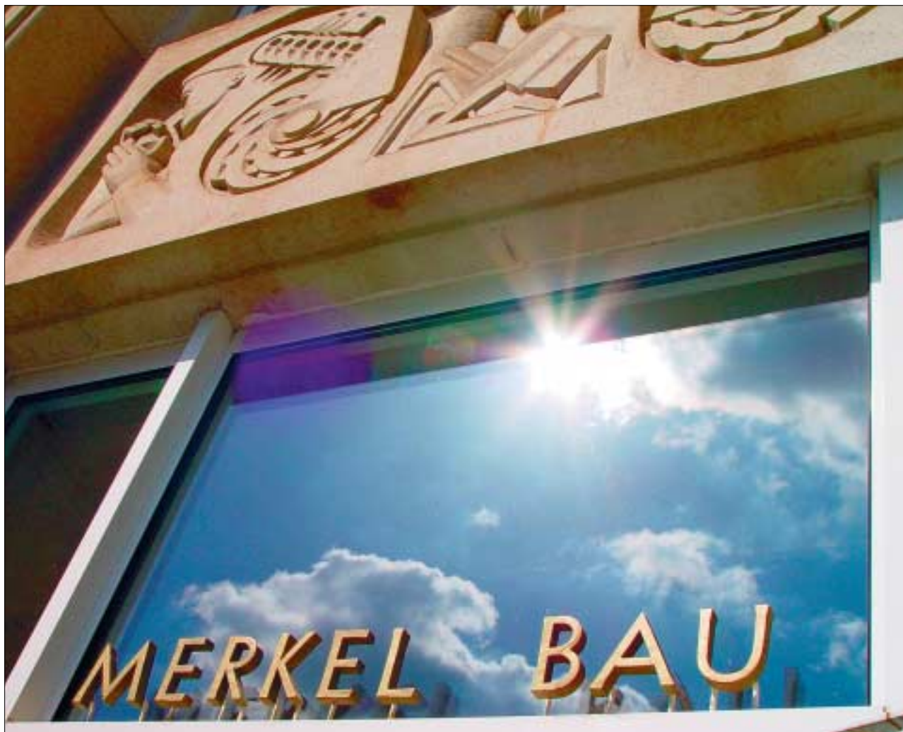
Der Dresdner Maler und Bildhauer Max Lachnit (1900 – 1972) schuf 1955/56 die beiden Reliefs am Merkel-Bau. Sowohl für die Hallenstirnseite als auch für den Haupteingang (Foto) verwendete der Künstler technische Motive. Im Gebäude an der Helmholtzstraße sind drei Institute der Fakultät Maschinenwesen untergebracht.