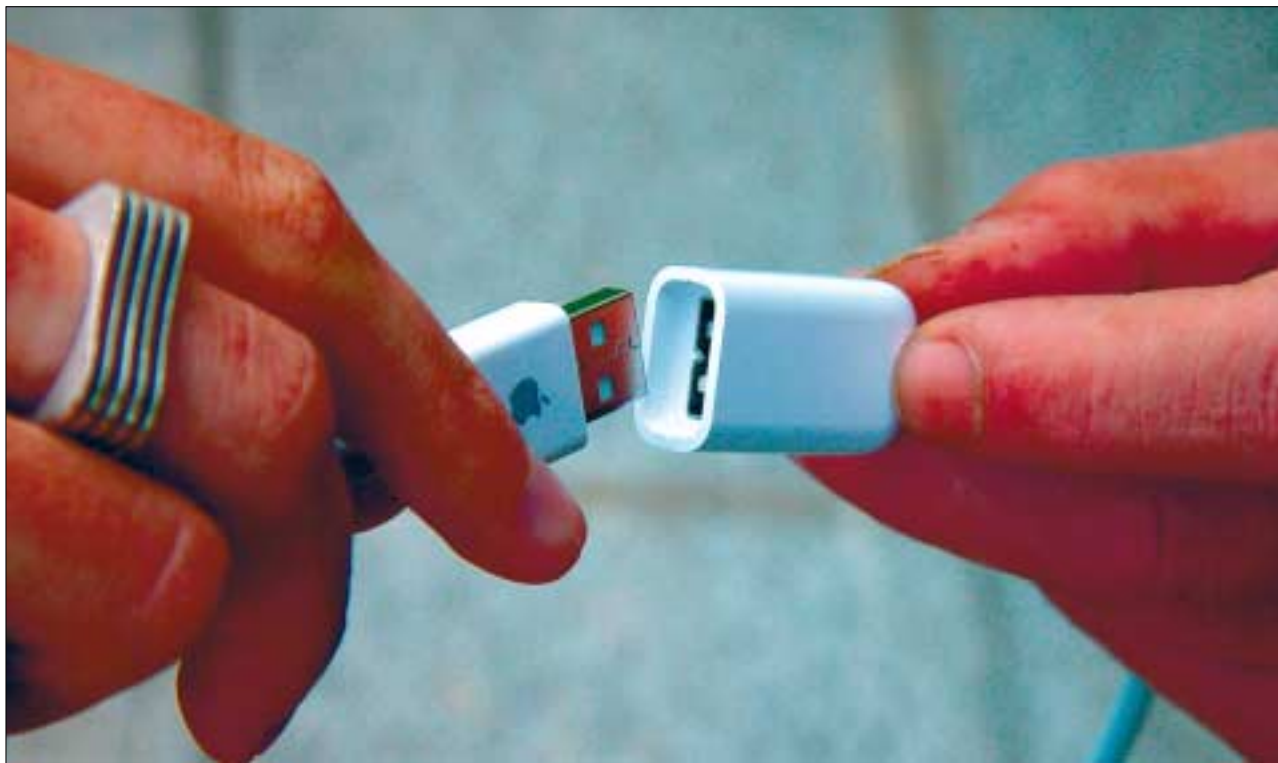
Verbindungen schaffen – Journalisten und Wissenschaftler sollen vom IDW zusammengeführt werden.

Gegründet wurde der IDW 1995 als Gemeinschaftsprojekt der Pressestellen der Universität Bayreuth, der Ruhr-Universität Bochum sowie der TU Clausthal in Zusam-