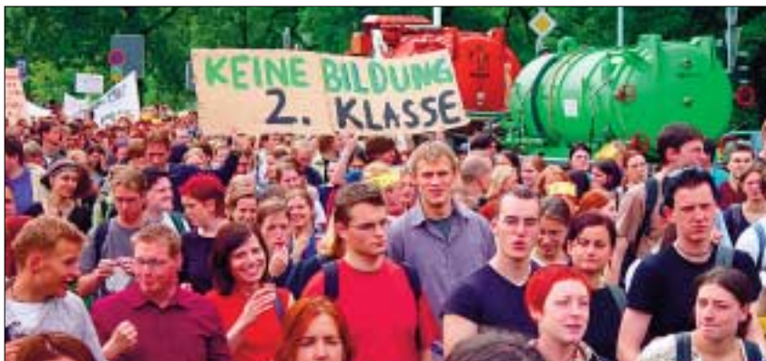
Studenten demonstrierten gegen die Kürzungspolitik.

Der Senat der Technischen Universität Dresden fordert die sofortige Aufhebung des Einstellungsstopps und der Haushaltssperre.