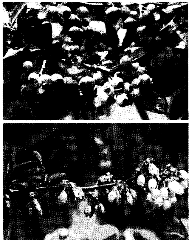
図1 水耕栽培実験中のハイブッシュブルーベリー

ブルーベリー Blueberry は好酸性・好アンモニア性を有すると言われていたことに着目し、著者らは1981年から、これらの特性に関して栄養生理学的側面から研究を続けてきた。ここでは、その研究成果の概要を報告したい。ブルーベリーは北米原産のツツジ科スノキ属 Vaccinium spp. の低木性果樹で、ハイブッシュブルーベリー Highbush blueberry (ハイブッシュ) (図1)、ラビットアイブルーベリー Rabbiteye blueberry (ラビットアイ)、ローブッシュブルーベリー Lowbush blueberry (ローブッシュ) の3種類が産業的には重要である 1,2) 。ハイブッシュは近年さらに、北部ハイブッシュ Northern highbush、半樹高ハイブッシュ Half-high highbush、南部ハイブッシュ Southern highbush の3グループに分類されている。米国やカナダでは野生のブルーベリーが豊富なため、長い間野生種の果実が採