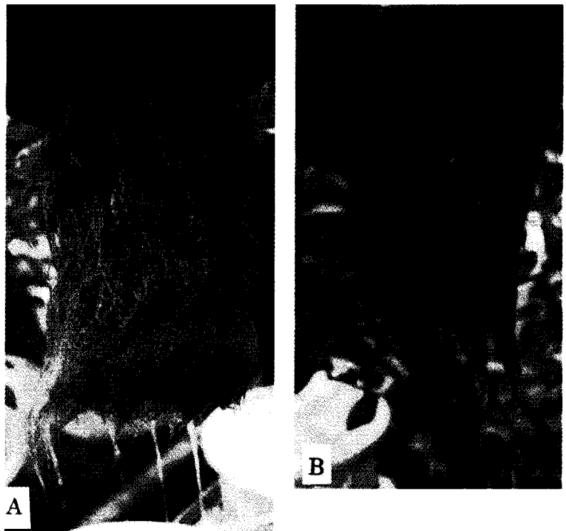
図3 ラビットアイブルーベリーの根の発育に及ぼす培養液 pH の影響 A: pH4、B: pH6

かったことから、培地 pH に関する研究は古くより行われてきた 4,6) 。しかし、供試樹の種類・品種・樹齢、実験条件などの違いから必ずしも統一的な結果は得られていなかった。本研究では水耕法 ( \text{NH}_4\text{-N} + \text{NO}_3\text{-N} 施用) により、ハイブッシュおよびラビットアイの生育および養分吸収に対する培養液 pH の影響を検討した 7,8) 。その結果、両種