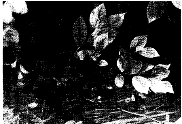
図2 中性の土壌で生育するラビットアイブルーベリーに発生した葉のクロロシス

取、利用されていた。品種改良や栽培、発育生理の研究が始められたのは1900年代の初めになってからであり、1930年頃から実用的な品種が発表され始めた 3) 。1950年頃からは次第に栄養生理的研究も行われるようになった 4) 。これらにより、ブルーベリーは耐乾性が低く、土壌 pH が中性付近では葉に