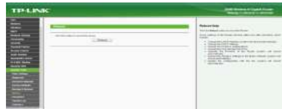
Gambar 11 Reboot Router