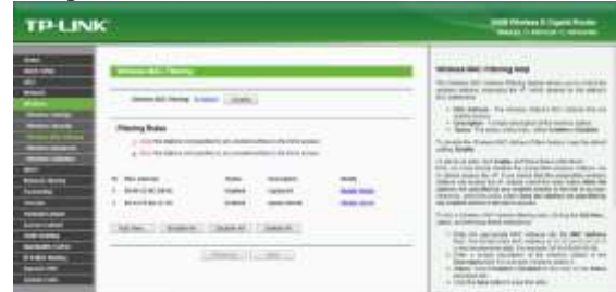
Gambar 10 Tampilan saat daftar Mac Filter selsai

Tampilan saat daftar mac filter selesai dibuat