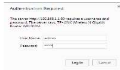
Gambar 3 Langkah ke Dua