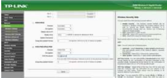
Gambar 6 Langkah ke Empat