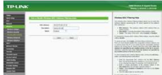
Gambar 9 Pilihan Enable Mac Filtering

Tampilan saat daftar mac filter selesai dibuat