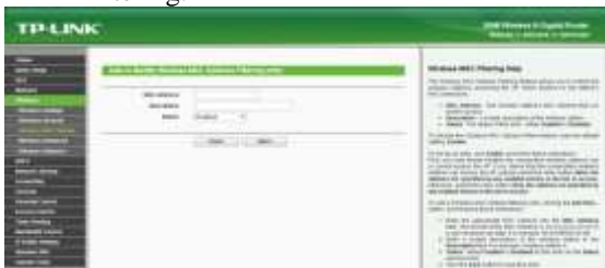
Gambar 8 Setting Mac Address Filtering di wireless TP-LINK TL-WR1043 ND