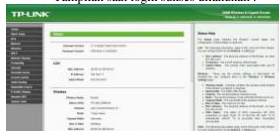
Gambar 4 Tampilan Login Sukses