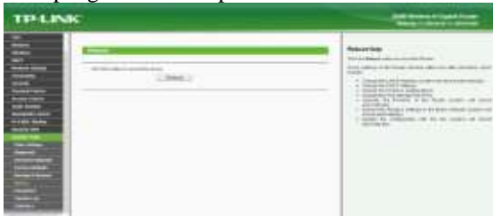
Gambar 7 Pilihan Sistem Tool