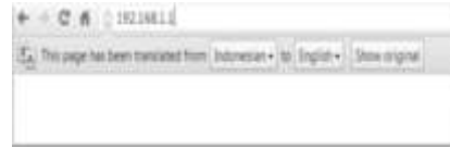
Gambar 1 Langkah Pertama

Kemudian akan tampil halaman login seperti berikut :