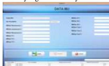
Gambar 1 Antar muka pada Aplikasi pemilihan Program Studi

Pada Gambar 2 menjelaskan bahwa form tersebut digunakan untuk memasukan nilai-nilai serta Kriteria yang ada di fuzzy.