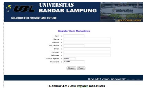
Gambar 4.9 Form register mahasiswa

Form ini bisa digunakan untuk register mahasiswa pada mahasiswa yang belum pernah melakukan Register sebelumnya. Mahasiswa diwajibkan untuk mengisi form ini karna data tersebut yang nantinya akan mendapat akses login, data tersebut harus valid karna data tersebut yang nantinya akan diperiksa oleh admin jika data tersebut valid maka mahasiswa tersebut baru dapat diberi akses login jika tidak sebaliknya.