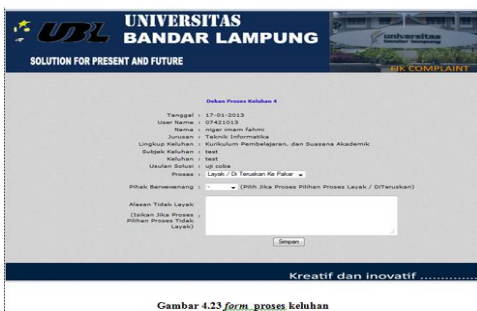
Gambar 4.23 form proses keluhan

Di form ini terdapat keluhan yang akan diproses untuk diteruskan ke pihak berwenang, tetapi sebelumnya keluhan ini harus ditinjau dahulu apakah keluhan ini layak atau tidak layak untuk di proses.