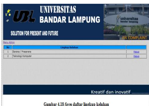
Gambar 4.18 form daftar lingkup keluhan

Di form ini berisikan daftar lingkup keluhan yang terlebih dahulu sudah tersimpan dan di form ini juga bisa menghapus lingkup keluhan dengan cara pilih lingkup keluhan yang akan dihapus didalam baris lingkup keluhan yang anda pilih ada link hapus, admin harus mengklik tombol hapus jika admin ingin menghapus lingkup keluhan tersebut.