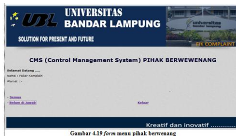
Gambar 4.19 form menu pihak berwenang

Di form ini pihak berwenang bisa melihat semua daftar keluhan dan bisa juga melihat daftar keluhan yang belum dijawab oleh pihak berwenang tetapi sebelumnya pihak berwenang harus melakukan login terlebih dahulu untuk bisa mengakses form ini. Di form ini terdapat link keluar link tersebut berfungsi untuk keluar dari situs tersebut.