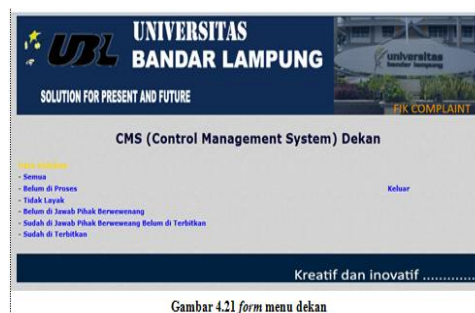
Gambar 4.21 form menu dekan

Form ini menampilkan menu yang hanya dapat digunakan oleh dekan. Dekan mempunyai peranan besar dalam fik complaint, dekan harus melihat isi keluhan dan memberikan tugas kepada pihak berwenang untuk menjawab keluhan