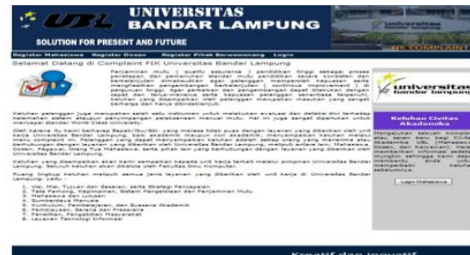
Gambar 4.8 Form Home