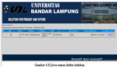
Gambar 4.22 form semua daftar keluhan

Form ini berisi semua daftar keluhan yang sudah dikirim dari mahasiswa atau dosen. Di form ini dekan bisa melihat keluhan secara detail dengan mengklik detail yang ada di menu dekan.