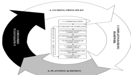
Gambar 2.1 Model Penanganan Keluhan ISO 10002:2004

Dalam sebuah organisasi yang akan mengimplementasikan standar ISO 10002:2004 mengenai Sistem penanganan keluhan, mempunyai dua tujuan utama yaitu dapat menangani keluhan dengan baik sehingga hal tersebut memberikan kepuasan baik secara internal maupun eksternal, keluhan yang ditangani dapat menjadikan peningkatan kinerja sebuah pelayanan, indikator dari sebuah kepedulian dan kepuasan pelanggan adalah dengan memberikan complaint atau keluhan. Dalam Standard ISO 10002 : 2004 terdapat model dalam penanganan sebuah keluhan seperti dijelaskan dibawah ini.