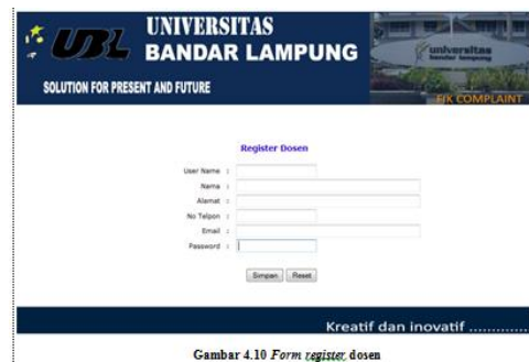
Gambar 4.10 Form register dosen

Form ini bisa digunakan untuk register dosen pada dosen yang belum pernah melakukan register sebelumnya. dosen diwajibkan untuk mengisi form ini karna data tersebut yang nantinya akan mendapat akses login, data tersebut harus valid karna data tersebut yang nantinya akan diperiksa oleh admin jika data tersebut valid maka dosen tersebut baru dapat diberi akses login jika tidak sebaliknya.