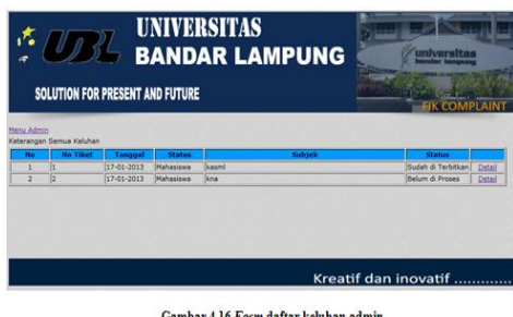
Gambar 4.16 Form daftar keluhan admin

Form ini berisikan semua daftar keluhan mahasiswa, form ini hanya dapat di akses oleh admin. Admin di form ini hanya dapat melihat tanggal, status, subjek dan status keluhan tersebut karna harus menjaga kerasian data bagi user yang telah memberikan komplain kepada Fik UBL.