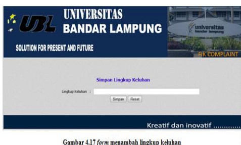
Gambar 4.17 form menambah lingkup keluhan

Dalam menu admin terdapat menu simpan lingkup keluhan yang berfungsi untuk menambahkan lingkup keluhan jika ada penambahan dalam lingkup keluhan.