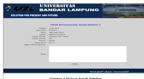
Gambar 4.20 form Jawab Keluhan

Di form ini pihak berwenang dapat menjawab sebuah keluhan yang sebelumnya telah diberi tugas oleh dekan untuk menyelesaikan keluhan tersebut, jika pihak berwenang sudah menjawab keluhan tersebut maka pihak berwenang harus menekan tombol simpan.