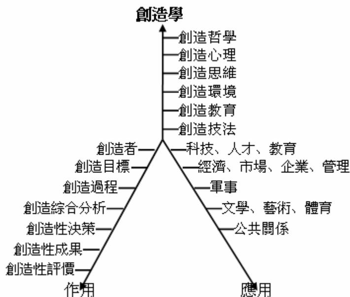
圖 1 中國創造學理論框架