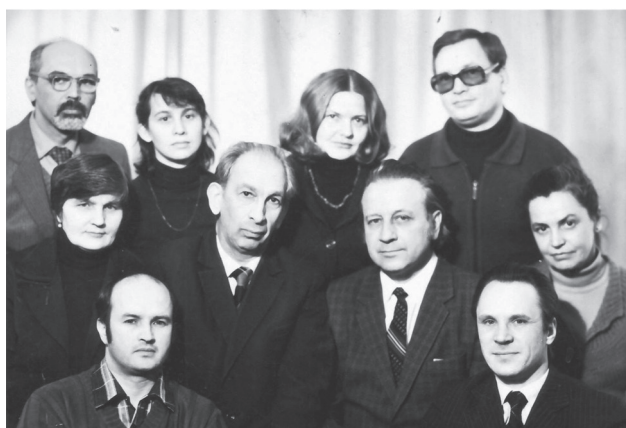
Рис. 3. Коллектив лаборатории дозиметрии внешней среды (1975 г.)

В 1975 г. лаборатория прижизненных измерений была переименована в лабораторию дозиметрии внешней среды (ДВС) в составе отдела радиационной дозиметрии, а ее название приблизилось к сегодняшнему (рис. 3).