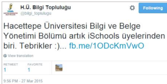
Şekil 5. Örnek 3'te gösterilen künyenin Tweet paylaşımı