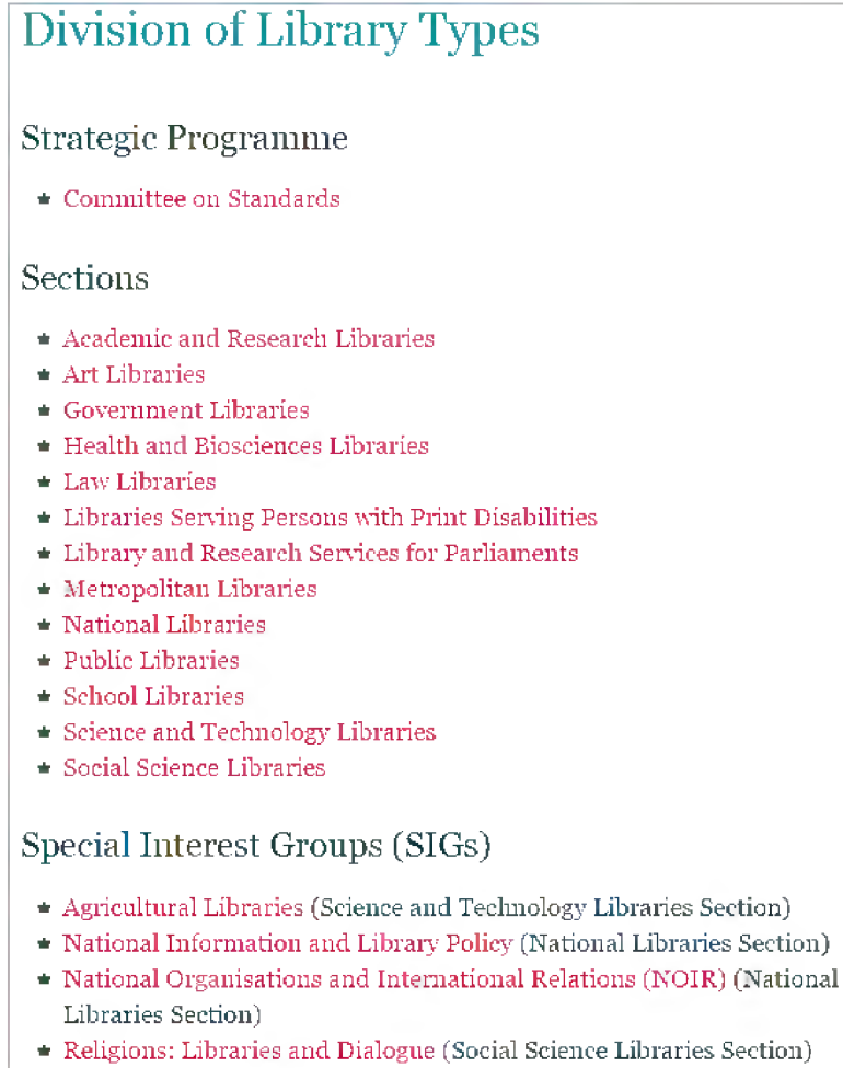
(Şekil 2): Kütüphane Türleri Bölümü (IFLA, 2016c)

IFLA'nın çalışma yapısının daha iyi anlaşılabilmesi adına Şekil 2'de Kütüphane Türleri Bölümü ile ilgili olan bağlantılar gösterilmektedir. Kütüphane Türleri, Stratejik Program olarak Standartlar Komitesi ile ilişkilendirilmekte, Birim olarak ise Akademik ve Araştırma Kütüphaneleri, Sanat Kütüphaneleri, Devlet Kütüphaneleri, Sanat ve Yaşam Bilimleri Kütüphaneleri, Hukuk Kütüphaneleri, Engellilere Yönelik Hizmet Veren Kütüphaneler, Parlamento Kütüphaneleri, Metropol Kütüphaneleri, Ulusal Kütüphaneler, Halk Kütüphaneleri, Okul Kütüphaneleri, Bilim ve Teknoloji Kütüphaneleri, Sosyal Bilim Kütüphaneleri şeklinde ayrılmaktadır. Konuyla ilgili Özel İlgi Grupları altında ise Tarım Kütüphaneleri, Ulusal Bilgi ve Kütüphane Politikası, Ulusal Organizasyonlar ve Uluslararası İlişkiler, Dinler: Kütüphaneler ve Diyalog şeklinde bir sınıflamaya gidilmiştir.