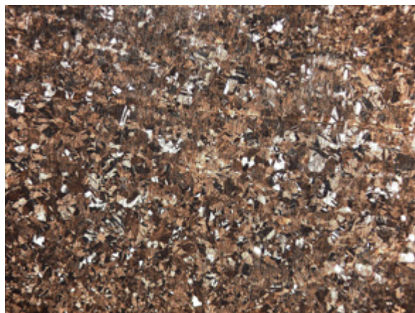
Fig. 5 Microestructura de la hoja de la espada de Peñalosa en la que se aprecian los granos mezclados sin deformar (X50).

hallados en la Terraza Superior (BE_28880 y BE_28210) y otro de dos remaches recuperado en la Terraza Intermedia (BE_10155), que llegan a alcanzar una media de 196,6 HV (DT 27,1), 209,3 HV (DT 8,2) y 145 HV (DT 26,3) respectivamente. El puñal de remaches (BE_45169) de cobre arsenical, próximo a la espada, tiene menor dureza (96,6 HV como media) aunque en el centro de la hoja alcanza los 126,5 HV. A su vez supera tales valores el hacha plana de cobre arsenical, procedente del fortín de Piedras Bermejas (11): entre los 132,5 y los 114,5 HV (131,9 HV como valor medio) (DT 13,6). Al compararla con la hoja de un puñal (BE_25040) con proporción semejante de estaño (9,40% Sn) y un forjado algo más intenso y regular que la espada, resulta que su valor medio de 183,9 HV (DT 40,6) la supera. Salvo el puñal BE_45169, los materiales comparados presentan una misma cadena operativa en la que, tras una forja en frío (FF), y un recocido no uniforme, aparece una nueva forja en frío por lo general bastante más intensa en el filo.