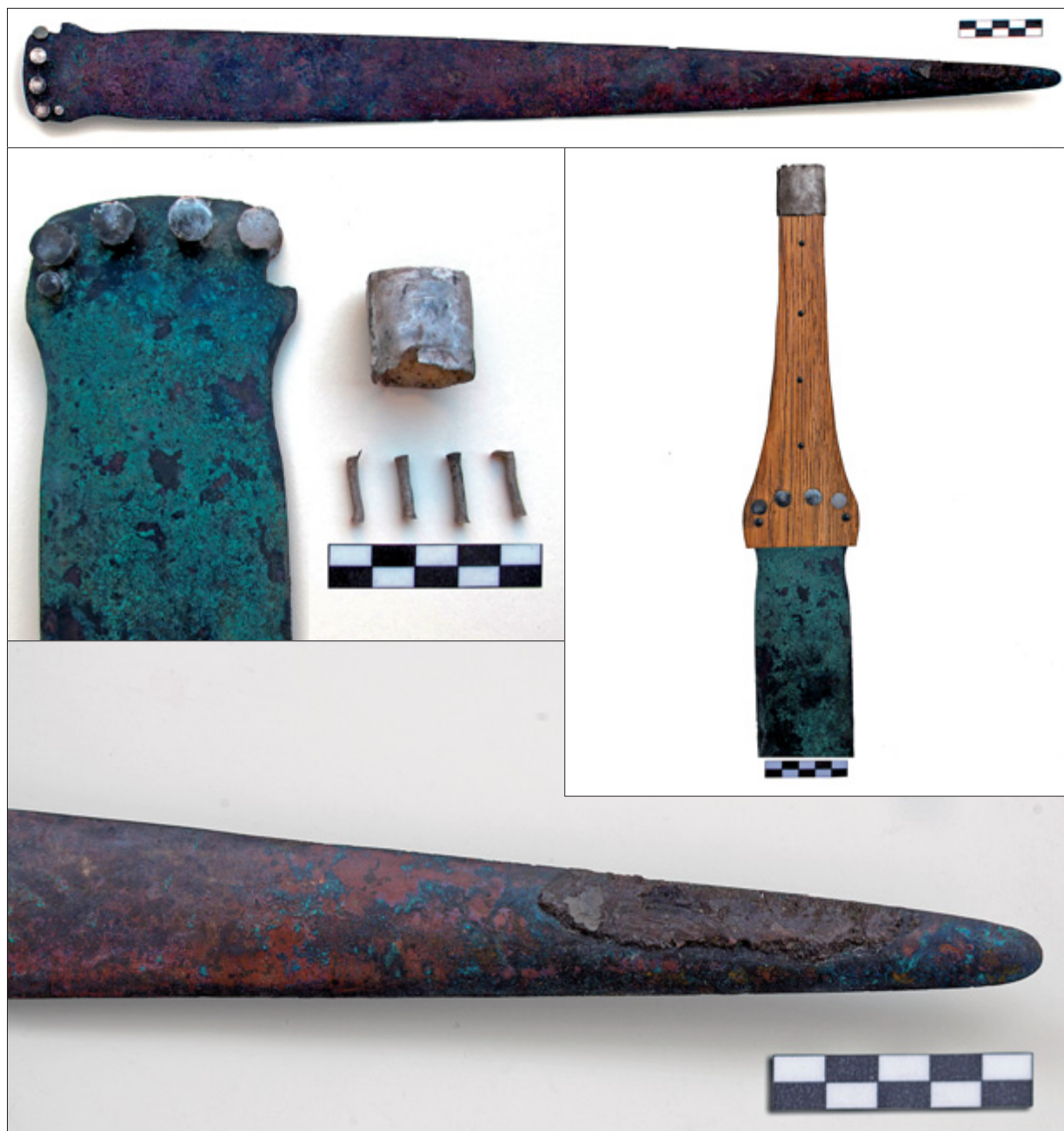
Fig. 4. La espada de Peñalosa: detalles de la zona de empuñadura y de la punta, e imagen reconstruida de la empuñadura.

2,75 cm del extremo proximal en base a la huella claramente remarcada.