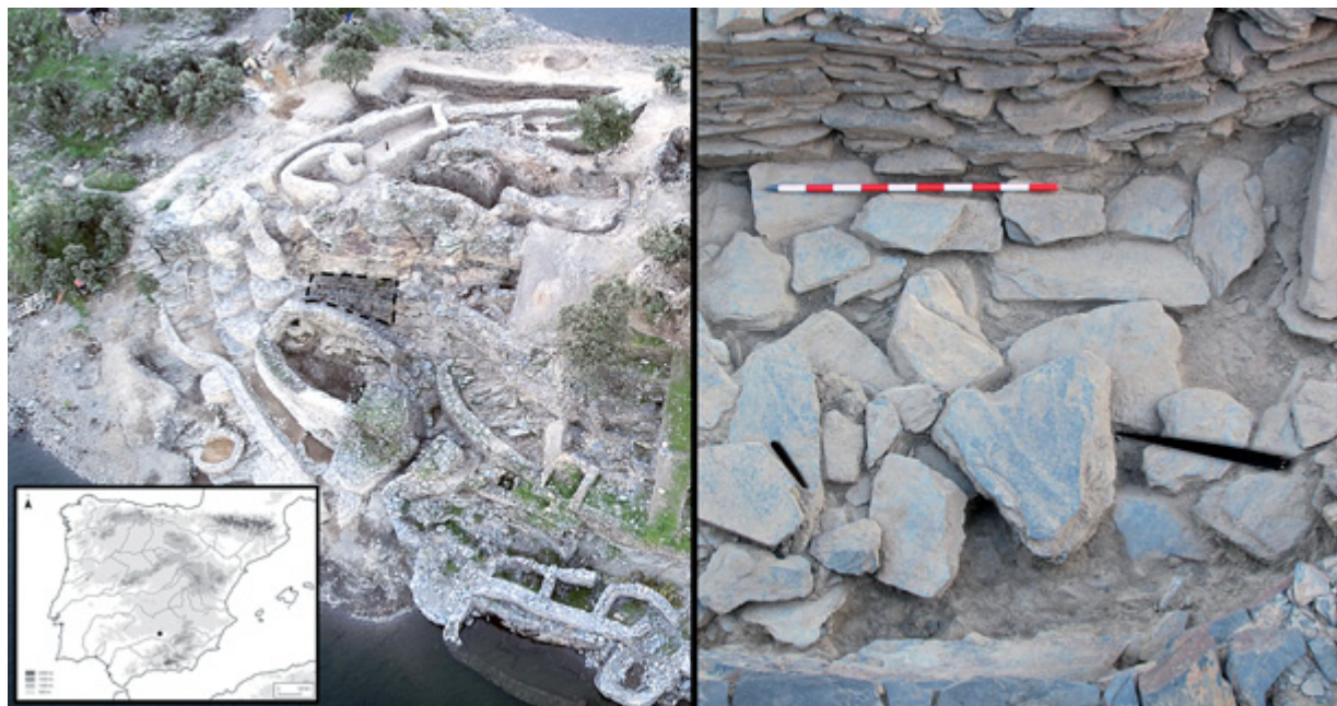
Fig. 1. Localización del poblado de Peñalosa en la Península Ibérica. Vista aérea con el sector 45 sombreado, en cuyo Complejo Estructural XIVa apareció la espada con un puñal de dos remaches (a la derecha localización de ambos).

acrópolis se sitúa a unos 4 m sobre este espacio, emergiendo sobre un farallón pizarroso delimitado por un cierre amurallado bajo el que se irán distribuyendo los diferentes ámbitos del poblado sorteando las pendientes de ambas laderas mediante calles y zonas de paso, adaptadas a las curvas de nivel. El conjunto, la acrópolis y el resto del poblado, está bordeado a su vez por una línea de muralla que va estrangulando el espacio habitable en sentido noreste-noroeste. Aquí la inaccesibilidad al interior del poblado está asegurada por el impresionante cortado en vertical sobre el que se asienta (Contreras 2000; Contreras y Cámara 2002).