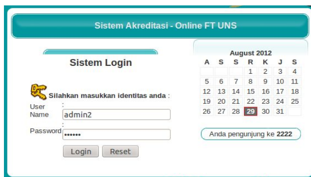
Gambar 1. Halaman Autentifikasi Pengguna

Beberapa hasil capture interface aplikasi ditampilkan pada gambar 1 sampai dengan gambar 6 dibawah ini.