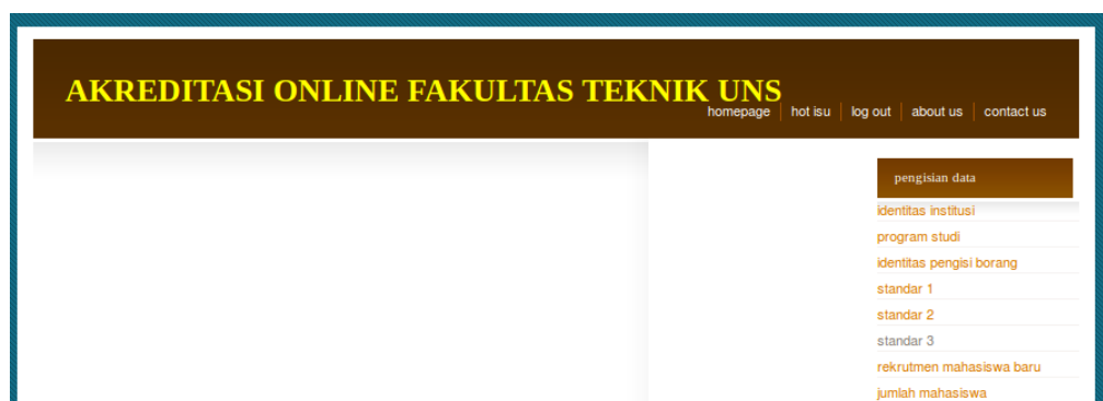
Gambar 2. Halaman utama aplikasi

Capture interface untuk pengisian data narasi menggunakan TinyMCE, tampak pada gambar 3.