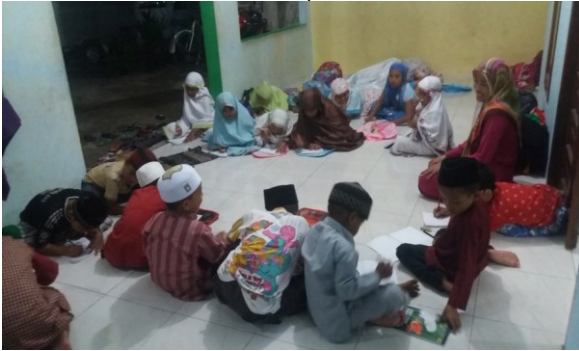
Gambar: Bimbingan Akhlak (Sifat Terpuji dan Tercela) 16

Keterangan: Suasana anak-anak peserta Kegiatan keagamaan.