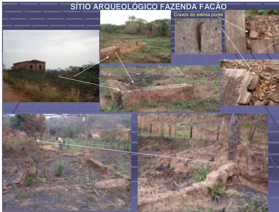
Fazenda Facão: potencial histórico e arqueológico.

O local também possui um sítio histórico relativo à Fazenda Facão, cujas estruturas estão em estado de deterioração e sem medidas de preservação. Os locais ainda edificados são: casarão com estruturas de trabalho, escola e igreja, além disso, quatro bases de casas em ruínas, aqueduto e estrutura de engenho, construção para represamento e desvio do curso de água, que segundo a tradição oral foi “feito pelos escravos”. As ruínas e os remanescentes existentes, no sítio, podem ser pensados em termos de um conjunto a ser evidenciado e preservado para sítio-museu, enquanto verdadeiros monumentos. O sentido dicionarizado dessa palavra é a “sobrevivência, na memória, de alguma coisa significativa para alguém ou para um grupo social; recordação, lembrança”, e mais ainda, é uma herança e sinal do passado com poder de perpetuação (LE GOFF, 1996). A musealização destas ruínas deve servir para refletir de forma crítica o que fazer e o que não fazer com o patrimônio. Por sua vez, o casarão, sendo restaurado, pode abrigar um espaço de recepção ao turista, sala de memória e venda de souvenirs, por exemplo. As ações necessárias nos dois contextos do sítio arqueológico Facão são bastante similares àquelas do sítio Carne Seca, acrescido da