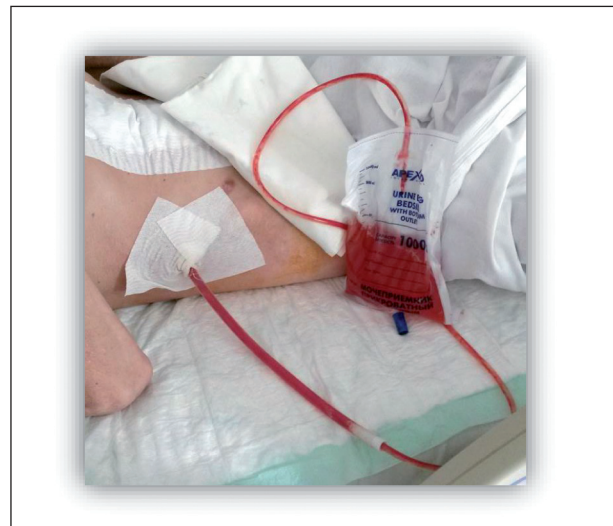
Рис. 1. Скопление лимфы по дренажу, 4-е сутки после удаления забрюшинной опухоли.

В зависимости от вида операции различался объем и время лимфоистечения. Максимально продолжительную и объемную лимфорею наблюдали