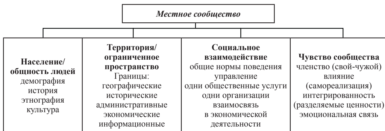
Рис. 1. Основные признаки местного сообщества.

Важнейшей характеристикой местного сообщества является его население со сложившейся историей, укладом жизни, традициями и принятыми правилами.