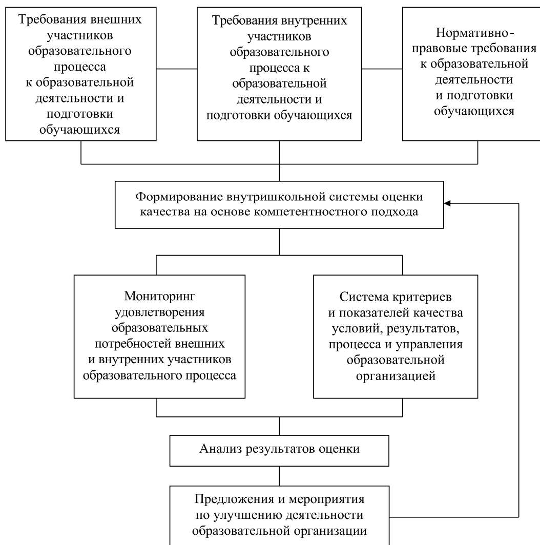
Рис. 1. Система компонентов формирования модели внутришкольной оценки качества деятельности образовательной организации

Концептуально процедура внутришкольной оценки качества деятельности образовательной организации может быть представлена в виде системы (рис. 1). Эта система открыта, потому что имеет связь не только с внутренними участниками образовательных отношений, но и с внешними; динамична, так как изменение требований (задач, целей) приводит к изменению других ее компонентов; имеет педагогический (методический) характер, так как в ней осуществляются педагогические процессы.