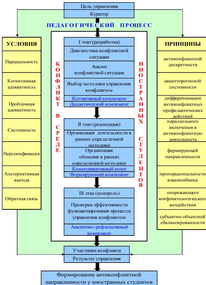
Рис. 3. Технология педагогического управления конфликтами в среде иностранных студентов (модель).

В своей исполнительской части педагогическое управление конфликтом предполагает приведение в действие движущих сил развития личности. Одновременно оно включает в себя и корректировку поведения участников конфликта, что обеспечивает единство объективного и субъективного в педагогическом процессе.