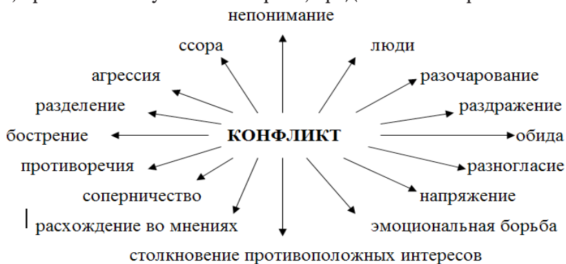
Рис. 1. Собираемая картина ассоциаций иностранных студентов, связанных со словом «конфликт»

В течение 2012 года, используя методы анкетирования, тестирования, интервьюирования, неформальных бесед и наблюдения, мы провели исследование состояния конфликтов в среде иностранных студентов БелГСХА им. В. Я Горина. Мы изучили отношение иностранных студентов к конфликтам, выявили их мнение относительно причин возникновения конфликтов, а также определили типичные формы их поведения в конфликтных ситуациях. Для того чтобы выяснить, что же такое конфликт в понимании иностранных студентов, мы использовали метод ассоциаций: студентам было предложено написать в центре альбомного листа слово «конфликт/conflict», затем на этом же листе было предложено записать вокруг слова «конфликт/conflict» все ассоциации, которые возникают у них, когда они слышат о конфликте. Собираемая картина ассоциаций иностранных студентов, принимавших участие в опросе, представлена на рис. 1.