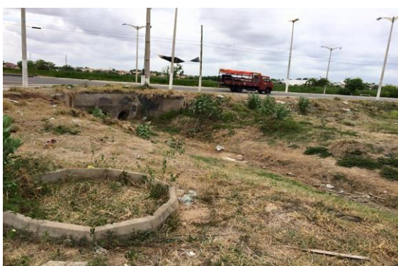
Avenida Marechal Castelo Branco

Conforme observações através de conversas e imagens (Figuras 1 e 2), atualmente os principais impactos detectados resultantes de ações degradantes na lagoa da Bastiana, são: aterramentos, desmatamentos, poluição hídrica, assoreamento, deposição de sedimentos, redução da biodiversidade, dentre outros.