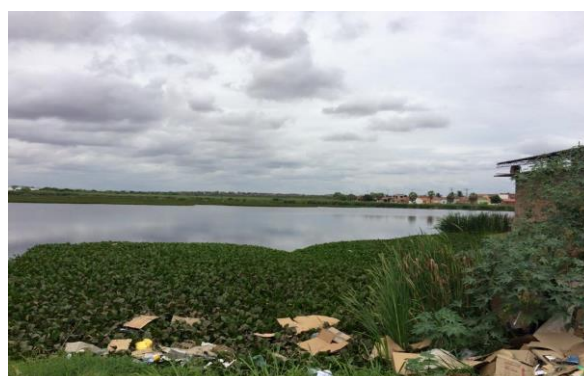
Poluição na Lagoa da Bastiana