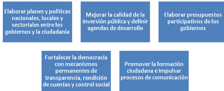
Figura 2. Influencia del ejercicio de participación ciudadana en los diferentes niveles de gobierno.

La participación de la ciudadanía en los diferentes niveles de gobierno en forma práctica se establece en cinco actividades que se declaran en el siguiente gráfico.