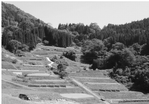
図2 山の傾斜地に作られた水田（稲刈り）

農村には都市にはない生活があり、それが都市在住者にとっての魅力となっているのは事実である。自家製の食材でつくる料理の味や、山の急斜面に広がる棚田に日本の原風景を思い描き、質問紙の回答