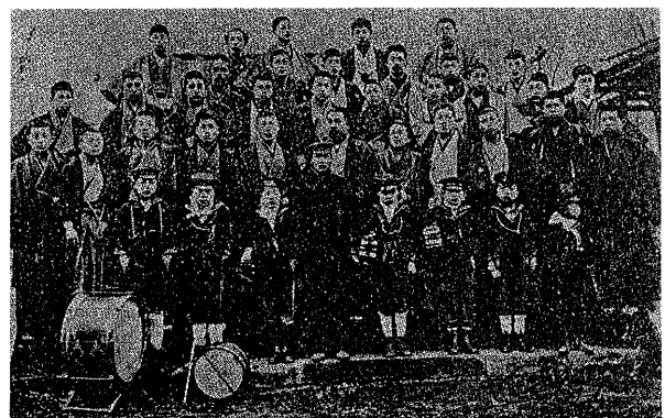
写真1 日清戦争時の兵士送迎のための少年音楽隊 引用文献9)より引用

『日本婦人洋装史』 2) から子供服に関する記述部分を要約すると、「生活改善同盟会は『児童服に関する