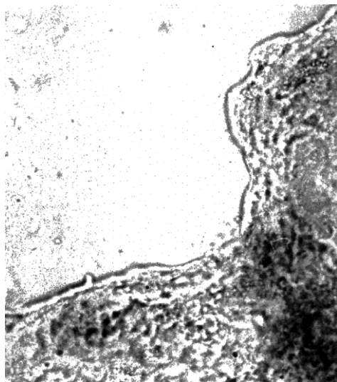
Рис. 1. Синцитиотрофобласт ворсинки плаценты роженицы, перенесшей обострение герпес-вирусной инфекции (титр антител 1 : 12 800). Активность реакции на АТФ-азу резко снижается. Реакция по Падикюла—Херману. Ув. 90 \times 40

Параллельно проведенное гистохимическое исследование интенсивности реакции на АТФ-азу в плаценте показало снижение активности на стандартную единицу площади в синцитиотрофобласте с (4,50 \pm 0,03) усл. ед. (контроль) до (2,10 \pm 0,04) усл. ед. (обострение герпесной инфекции; титр антител к ВПГ-1 1 : 12 800) (рис. 1, 2).