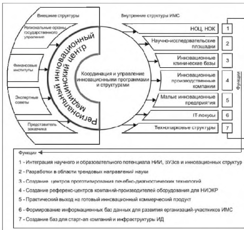
Рис. 1. Концептуальная модель региональной инновационной медицинской среды

В соответствии с предложенной концепцией ядром региональной ИМС является региональный инновационный медицинский центр (РИМЦ) с функциями управления инновационными программами и проектами, координации базовых площадок для ИД. РИМЦ объединяет инновационные клиники с функциями центров прототипирования лечебно-диагностических технологий, научно-образовательные, научно-исследовательские площадки, технопарковые структуры с IT-локусами и базой для старт-ап компаний, ИК.