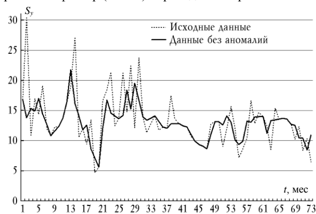
Рис. 1. Результаты применения метода Ирвина на временном ряде показателя VEGF

аномальные наблюдения исключены из исследуемых временных рядов и заменены на расчетные значения. Результаты для показателя «Васкулоэндотелиальный ростовой фактор (VEGF)» приведены на рис. 1.