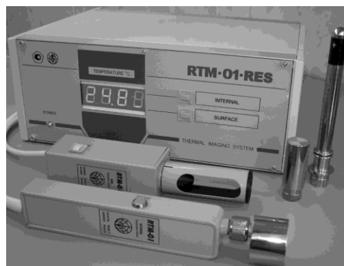
Рис. 1. Общий вид прибора РТМ-01-РЭС

Для оценки влияния индукторов овуляции на состояние молочной железы применялась радиотермометрия. Для измерения тепловой активности тканей молочной железы использовали диагностический комплекс РТМ-01-РЭС (рис. 1).