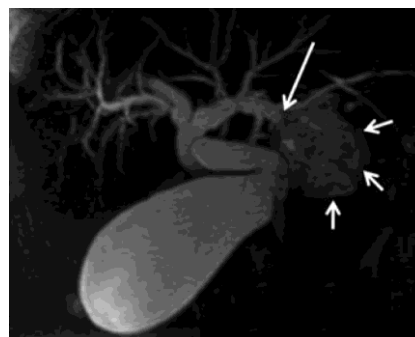
Рис. 6. 3D FR-FSE МРХПГ в кософронтальной плоскости. Эхинококковая киста — обозначена короткими стрелками, с формированием цистобилиарного свища — длинная стрелка