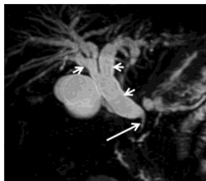
Рис. 5. 3D FR-FSE МРХПГ в кософронтальной плоскости. Доброкачественная стриктура терминального отдела холедоха — длинная стрелка, выраженная билиарная гипертензия — короткие стрелки