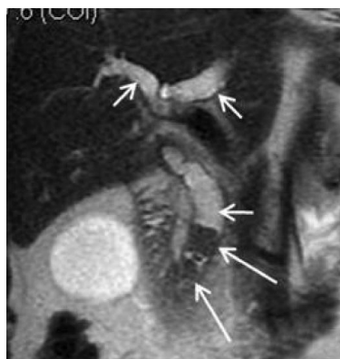
Рис. 4. T2-взвешенные изображения во фронтальной плоскости. Группа конкрементов в терминальном отделе холедоха — обозначена длинными стрелками, расширение холедоха и печеночных прото-

Достоверная визуализация уровня и причины обструкции, оценка состояния прилежащих органов напрямую повлияли на тактику хирургического вмешательства, увеличив количество малоинвазивных