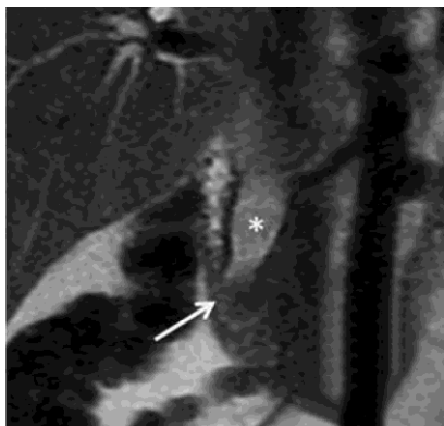
Рис. 3. T2-взвешенные изображения во фронтальной плоскости. Аденокарцинома большого дуоденального сосочка — обозначена стрелкой, с расширением холедоха — обозначен звездочкой

Доброкачественный генез в большинстве случаев был вызван холелитиазом у 53 пациентов (средний возраст 60,4 года, соотношение мужчин и женщин 1 к 1,7; рис. 4), стриктурой холедоха — у 10 (средний возраст 53,6 года, соотношение мужчин и женщин 1 к 1; рис. 5), эхинококкоз — 2 случая (сдавление извне и с формированием цистобилиарного свища; рис. 6) и острый панкреатит со сдавлением терминального отдела холедоха в 9 случаях.