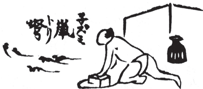
図1 葛飾北斎画『絵本早引』前篇「 ネズミトリ 鼠」(文化14年[1817]刊)