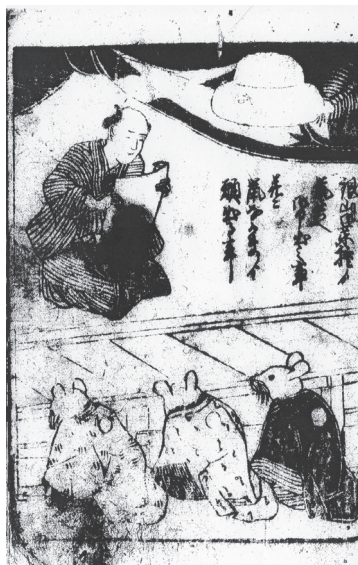
図6 『鼠共口上書』 絵表紙 銀山御葉種ノ鼠共へ御申出之事 并ニ鼠なかまノ願出る事

に、物語の表現においては、鼠の住む場所によって、鼠の性質が異なるものとして認識していた 26 。『鼠共口上書』においても、ドブネズミとクマネズミの2種類の区別を行っていたとはいいがたいが、家の中で害を及ぼす鼠には異なる種類があることが認識されている。また、これらの鼠とは別に、人に害を及ぼさない鼠として、こま鼠やなんきん鼠が登場する。この鼠は、芸をすることで子供たちを喜ばせる存在として描かれており、どぶ鼠などの害を及ぼす鼠とは区別されて描かれ、申渡の対象とはなっていない。(資料1)