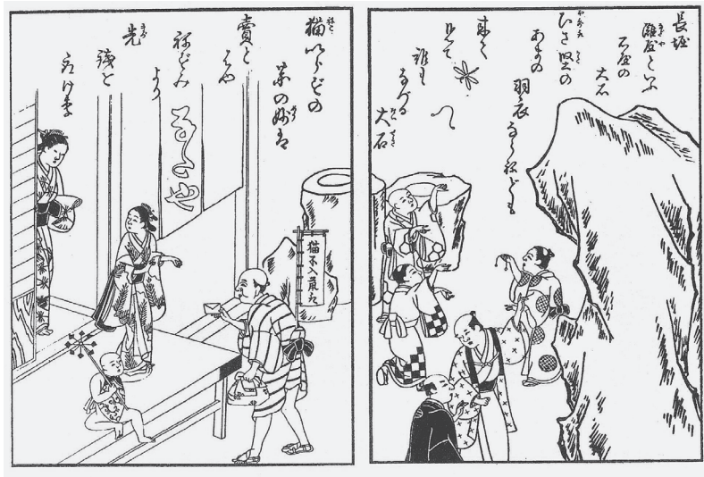
図2 『絵本加賀御伽』長堀 灘屋といふ石屋の大石 「猫いらずの薬の妙は賣とはや ねずみより先銭を取りり」

これに触ると枅が鼠の上に落ち被さるようにした「枅落とし」と呼ばれる、身近なものを使った簡易な仕掛け(図1)であった。身近な材料を用いた手軽ではあるが、効果のあまり期待できない仕掛けである。この仕掛けが用いられていた時期には、殺鼠剤が普及している。