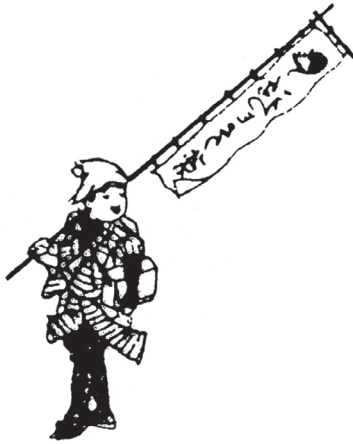
図3 『守貞謾稿』巻之六（生業下）「鼠取薬」の挿絵

この姿の行商は、大坂だけでなく、江戸でも同様であった。喜田川守貞の『守貞謾稿』巻之六（生業下）に、「鼠取り薬」として、江戸と京阪における行商の様子が紹介されている。殺鼠剤の行商は、『絵本加賀御伽』に描かれた姿と同様に、幟を背負って薬の入った箱を持つ行商の姿（図3）である。同様の鼠取り薬売りの姿は、絵入狂句集にもみられ、「単とり幟かついで猫背中」（『新選画本柳樽』初編）や、「建立のやうな身でうる鼠取」（『誹風柳多留』七一編、文政2年 [1819] 刊）のように、鼠取り薬売りの行商の様子や格好を詠んだ句がある。