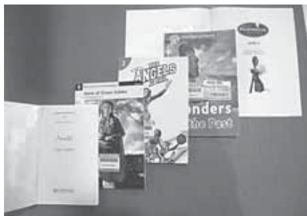
図2 レベル表記された英語多読法 Readers テキスト

そこで、図書館の書架でレベル毎に、あるいはレベルを重視して配架するような場合、各社の様々な内容のレベルを一定の基準で一元的に分けて示すことが、利用者のためには必要である。それには共通の基準あるいは統一化した指標を設ける必要があるが、多読のテキストには既にいくつかの標準化基準がある。