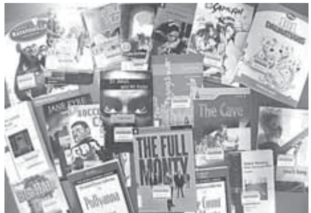
図1 各出版社の英語多読法 Readers テキスト

しかしながら、実はHeadword数も、出版社によって微妙に出し方、数え方は異なっている。