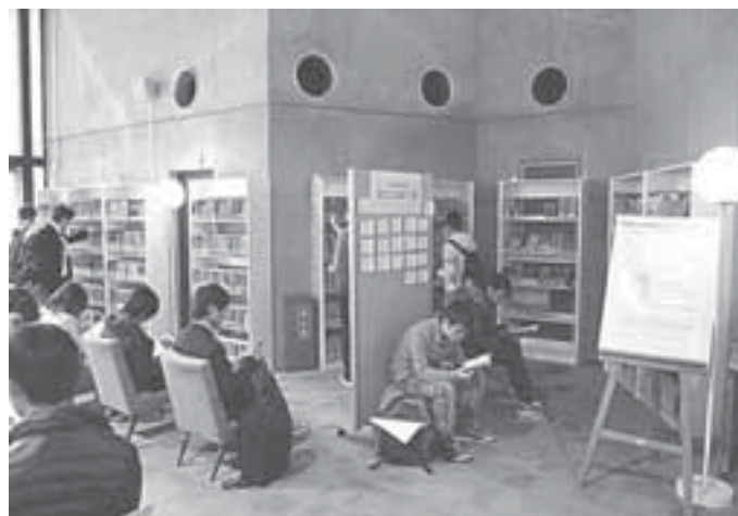
英語多読リーダーズコーナー

平成 24 年には、5 名の教員が担当することとなり、履修生も倍増することとなった。この年度のリーダーズ購入は約 2,500 冊で、リーダーズコーナーは合計で 5,500 冊を超える規模となった。平成 24 年度 12 月には、本