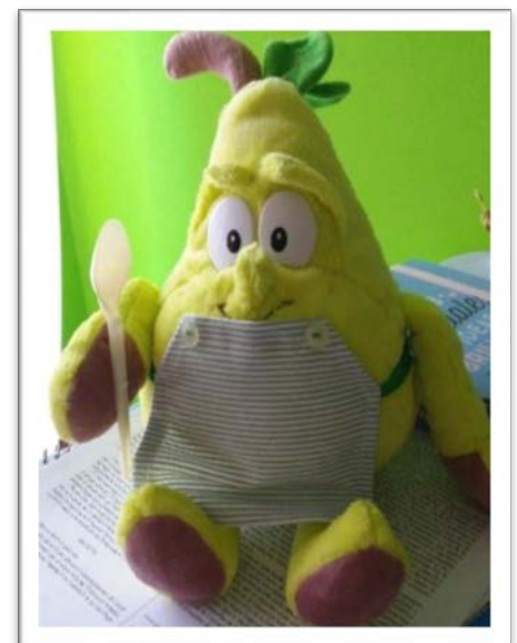
Figura 2. “La pera cocinera” mascota viajera.

Con esto lo que se pretende es asegurarnos de que los familiares del niño o niña conocen qué alimentos forman parte de una buena alimentación y que los alumnos y alumnas puedan disfrutar de una experiencia saludable de primera mano. Es un recurso complementario de otras actividades llevadas a cabo en el huerto escolar, donde pueden vivir experiencias muy enriquecedoras y ampliar su conocimiento sobre las frutas y verduras antes de elaborar las distintas recetas.