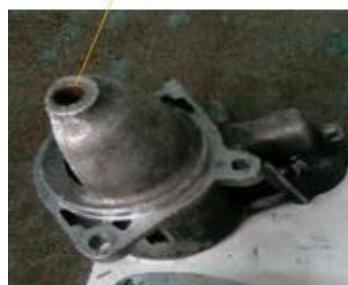
Casquillo carcasa lado piñón

Para proceder a reparar a mesma temos que desarmar o mesmo.