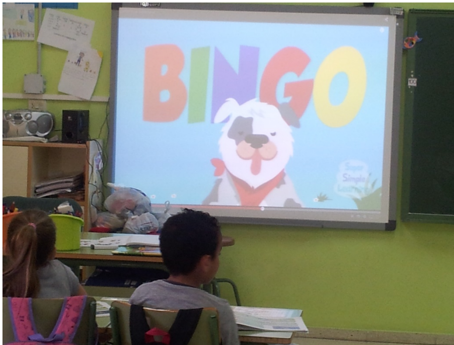
Profesora en clase de música

Una vez aprendida tanto musicalmente así como la correcta pronunciación, se divide a la clase en cinco grupos asignándole a cada uno una estrofa de la canción. Los alumnos deberán cantar cuando les toque realizando las palmas necesarias dependiendo de las letras a omitir en la palabra B-I-N-G-O.