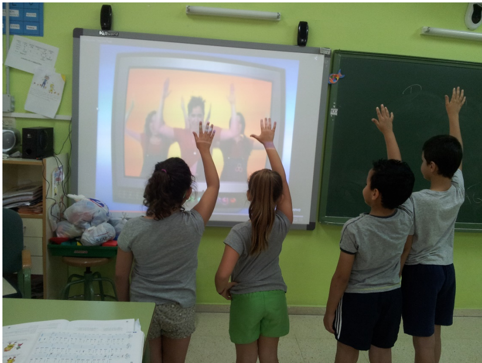
Profesora en clase de música

En cuanto a los materiales , se ha utilizado como material impreso y manipulativo la letra de las canciones que se le asigna a cada grupo de alumnos y los materiales para escribir y realizar la actividad, y como material informático el ordenador para posteriormente escuchar las canciones que serán cantadas por los alumnos.