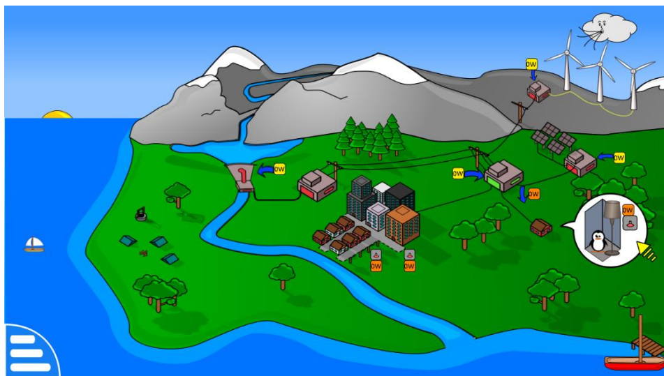
Imagen 6. Energías renovables

Desarrollo de la actividad: La actividad consiste en reactivar el sistema eléctrico de la casa de Tux(un pesacador), cuando vuelva de pescar con su barco. El alumno tiene que hacer clic sobre todos estos elementos: el sol, las nubes, la presa de agua, los paneles de energía eólica, paneles solares y transformadores con el fin de reactivar el sistema eléctrico de la casa del pescador por completo. Cuando el sistema eléctrico este de vuelta y Tux este en casa, el alumno tiene que encender la luz por él. Para ganar el juego, hay que encender todos los consumidores de la luz una vez que todas las fuentes de energía estén funcionando (ver imagen 6).