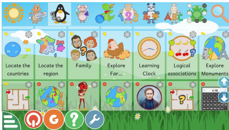
Imagen 1. Captura de la página de inicio de Gcompris con los tableros de las actividades propuestas.

El hecho de abarcar actividades de distinto grado de complejidad dirigidas a niños de dos etapas educativas entre infantil y primaria, hace que este software educativo sea un recurso educativo ideal para los alumnos con necesidades especiales, ya que dependiendo del nivel competencial del alumno y sus conocimientos previos puede hacer una tarea o otra. Es más, en las tareas que van aumentando de complejidad como las de los laberintos, los niños con adaptación curricular significativa pueden hacer solo una parte de la misma logrando así menos estándares de los que recoge el criterio de evaluación que hemos marcado para la actividad en cuestión.